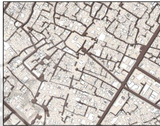
تصویر (۱): وجود تعدد و تنوع در دسترسی‌های بافت قدیم شهر یزد

سلسله مراتب فضایی، در تمام موارد طراحی اعم از طراحی شبکه خیابان یا طراحی تک واحدهای مجاور خیابان (با توجه به ابعاد، تعداد و نحوه ترکیب آنها) در پایداری کل بسیار مؤثر است.