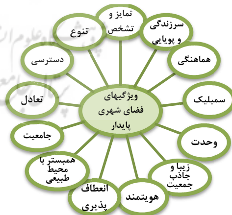
نمودار(۳): ویژگی‌های فضای شهری پایدار با رویکرد بوم‌گرا

نمودار شماره (۳)، ویژگی‌های فضای شهری پایدار را با توجه به معیارهای فوق به نمایش می‌گذارد: