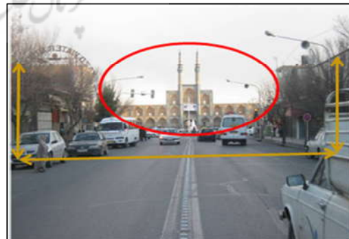
تصویر (۴): محصوریت، وجود عناصر منحصر به فرد در خیابان قیام شهر یزد

عناصر سخت، نرم و مقیاس عناصر و سطوح، نقش زیادی در پایداری و پایایی فضای معابر شهری دارد (امین‌زاده، ۱۳۸۱، ص ۵۷). محصوریت، نحوه محصورشدن از نظر ابعاد و