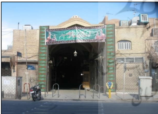
تصویر (۵): برگزاری مراسم مذهبی در بازارهای سنتی - بازارخان خیابان قیام شهر یزد

تناسبات بصری، آن بخش از خیابان‌ها که واجد تناسبات بصری مطلوبی هستند و به عبارتی در آن اغتشاش بصری کمتری وجود دارد، نسبت به سایر فضاها احتمالاً کمتر با تنش روانی در استفاده‌کنندگان از آن عین می‌شوند که یکپارچگی بدنه خیابان،