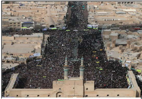
تصویر (۶): انعطاف‌پذیری و امکان فعالیت‌های گوناگون

انعطاف‌پذیری ، حضور همه گروه‌های اجتماعی در یک خیابان، با امکان فعالیت‌های گوناگون در آن تحقق پیدا خواهد کرد و خیابان باید انعطاف کافی برای تغییر را داشته باشد که از مشخصه‌های توسعه پایدار بوم‌گراست.