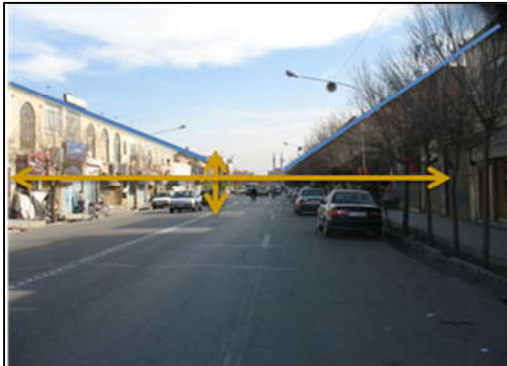
تصویر (۲): وجود هماهنگی، تعادل و وحدت در خیابان قیام شهر یزد

میزان استفاده و نیز ایجاد تعادل نحوه ترکیب حرکات پیاده و سواره می‌باشد. (امین‌زاده، ۱۳۸۱، ص ۵۷)