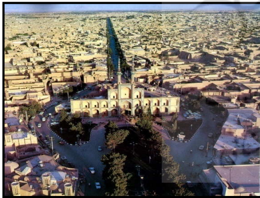
تصویر (۷): ایجاد خوانایی در خیابان با بهره‌گیری از نشانه شهری میدان امیرچخماق

• هویت و ویژگی‌های فرهنگی خاص هر شهر، حفظ و ارزش‌های مثبت فرهنگ محلی و تمایز و تشخیص خیابان نسبت به سایر شهرها و حتی در خود شهر تقویت شود. (لقایی، محمدزاده، ۱۳۷۸، ص ۳۹) • حس مکان از طریق ایجاد تناسب و تطابق میان ساختار فضایی، عنصر زمان، معنا، ارتباطات و فرهنگ اجتماعی که با توجه به رویکرد تقلید شکلی از سکونتگاه‌های سنتی برای دستیابی به مکان با هویت باید قابلیت‌های واقعی و ویژگی‌های انفرادی هر محل به صورت خاص شناسایی و جایگزین شود. (هاتون و پانکر، ۱۹۹۶)