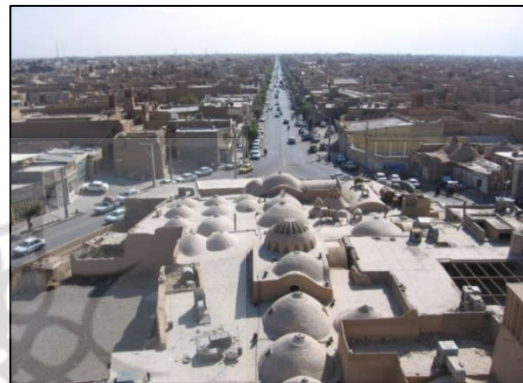
تصویر (۳): طراحی متناسب با اقلیم (استفاده از طاق‌های گنبدی شکل و مصالح بومی) - خیابان سلمان شهر یزد

عناصر سخت، نرم و مقیاس عناصر و سطوح، نقش زیادی در پایداری و پایایی فضای معابر شهری دارد (امین‌زاده، ۱۳۸۱، ص ۵۷). محصوریت، نحوه محصورشدن از نظر ابعاد و