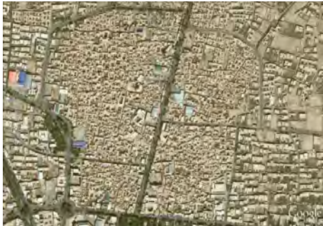
تصویر شماره ۲: نمایی از بافت تاریخی شهر اردکان

نهایت مشارکت آگاهانه و هدفمند مردم می‌تواند راه حل برون‌رفت از بحران باشد.