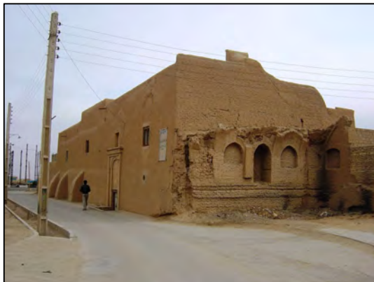
تصویر ۱- معبری در بافت تاریخی یزد

زیبایی شناختی آنها نیز فرصت نمود بیشتری می‌یابد. بازی‌های فرمی و جلوه‌های بدیع سایه روشن، صحنه‌های تأثیرگذاری را در این معابر به رخ می‌کشد. پذیرفتن اتفاقات پیشینی در یک محیط تاریخی و عدم تلاش در محور یا رفع آنها علاوه بر ایجاد فرصت‌هایی برای تشخیص و دریافت گذشته تاریخی در مکان مورد مشاهده، گاهی تشخیص صحیح رفتار اجزای سازنده آن مکان را نیز فراهم می‌آورد. گاهی، نحوه انتقال بار از طاق فراز کوچه به سهمی از دیواره آن به دلیل عدم تلاش سامان‌دهندگان معبر مشخص می‌شود. علاوه بر آن، تقویت کیفیاتی نظیر «غناي حسی» و «تناسبات بصری» نیز امری تبعی در این فراگرد است. (تصویر ۲)