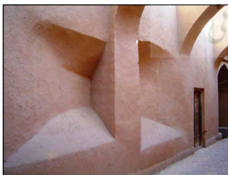
تصویر ۱- کوچه چهل محراب، فهادان یزد (مأخذ نگارنده)

زیبایی شناختی آنها نیز فرصت نمود بیشتری می‌یابد. بازی‌های فرمی و جلوه‌های بدیع سایه روشن، صحنه‌های تأثیرگذاری را در این معابر به رخ می‌کشد. پذیرفتن اتفاقات پیشینی در یک محیط تاریخی و عدم تلاش در محور یا رفع آنها علاوه بر ایجاد فرصت‌هایی برای تشخیص و دریافت گذشته تاریخی در مکان مورد مشاهده، گاهی تشخیص صحیح رفتار اجزای سازنده آن مکان را نیز فراهم می‌آورد. گاهی، نحوه انتقال بار از طاق فراز کوچه به سهمی از دیواره آن به دلیل عدم تلاش سامان‌دهندگان معبر مشخص می‌شود. علاوه بر آن، تقویت کیفیاتی نظیر «غناي حسی» و «تناسبات بصری» نیز امری تبعی در این فراگرد است. (تصویر ۲)