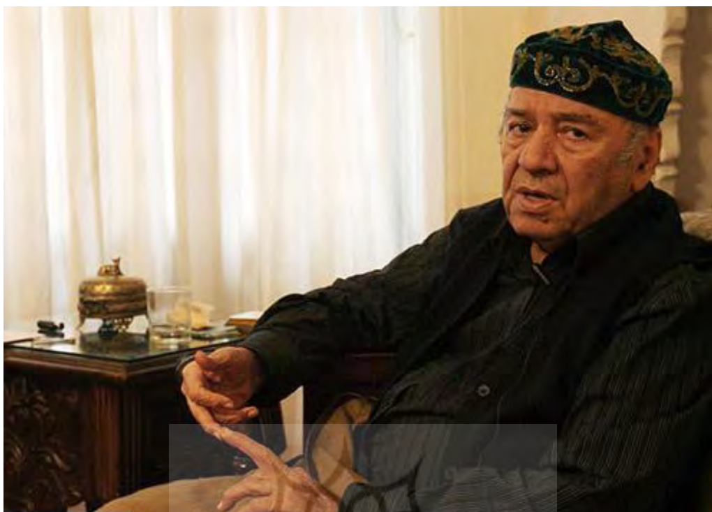
تصویر ۱. دکتر مظاهر مصفا

انتقاده کرده، فسادها را خیلی خوب دیده و ترسیم و تصویر کرده. این تصویر هم پنهانی نبوده و جنبه در واقع، مرموزگویی نداشته که ممکن است مخصوص یک زمان‌های خاصی باشد. خیلی صریح و پوست‌کنده تمام طبقات اجتماع را زیر تازیانه‌های مؤثر و تند نصیحت خودش گرفته و هرچه لازمه یک بشر متعهد در مقابل اخلاق، اجتماع و پروردگار بوده، گفته است؛ بدون هیچ پروا و محابایی. در این کار، شما می‌خواستید صحبت بکنید.