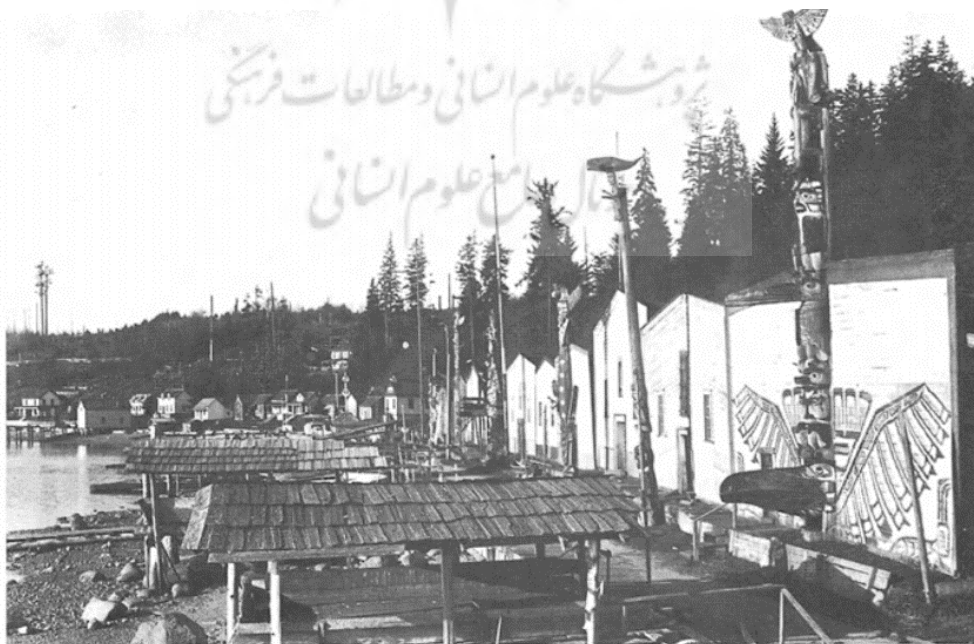
شکل ۱. خانه‌های قوم کواکیتول، پس از تأثیرپذیری از فرهنگ اروپایی (Walenz, 1981, 82).

محور گیتی، اغلب به شکل ستونی تصور می‌شد که مانع سقوط آسمان بود. این ستون از طرفی به خاطر مرکزیتش، راه ارتباط با امر قدسی بود و از سوی دیگر، نماد عنصری انسجام‌بخش، که تقریباً همه چیز به خاطر وجود آن، در نظم خویش باقی می‌ماند (همو، ۱۳۹۹، ۴۲). این درون‌مایه، به شکلی گسترده و در مناطق گوناگون، خود را به شیوه‌ی خاص هر فرهنگ نمایان کرده است. نمونه‌ی قابل رؤیت این تصور، راه شیری در افلاک و آسمان‌هاست. از نمونه‌های دیگر می‌توان سکامبه‌های هند، دیرک آسمان قوم نادتای فلوره و دیرک آدمخواران منطقه‌ی کواکیتول (شکل ۱) را یاد کرد که در مورد آخر بیش از نیمی از ستون، از سقف خانه‌ی آیینی بالا می‌آمد و ساختار کیهانی به خانه می‌بخشید و در مراسم تشرف نوآموزان، از آن به عنوان مرکز جهان یاد می‌شد (همو، ۱۳۹۳، ۱۹۸-۱۹۹).