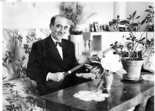
تصویر ۳. ابوالحسن صبا