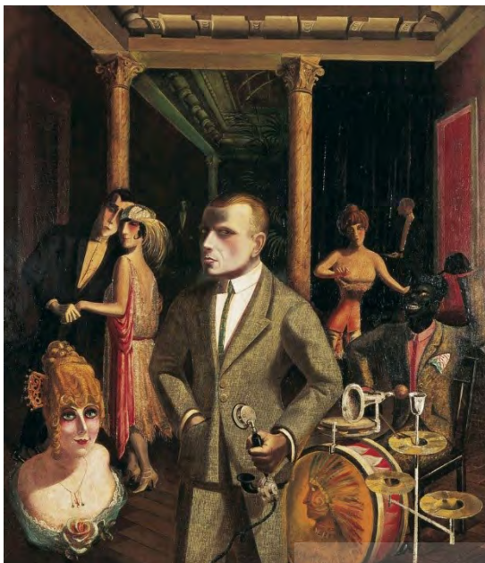
تصویر ۳ نقاشی «ورق بازان» اتودیکس ۱۹۲۰ اتودیکس ۱۹۲۲