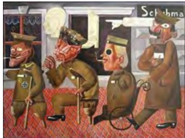
تصویر ۵. نقاشی «فلج های جنگی» اتودیکس ۱۹۲۰

Ann Murray, (۲۰۲۱). Academia Letters, Article. ۱۱۲۸.