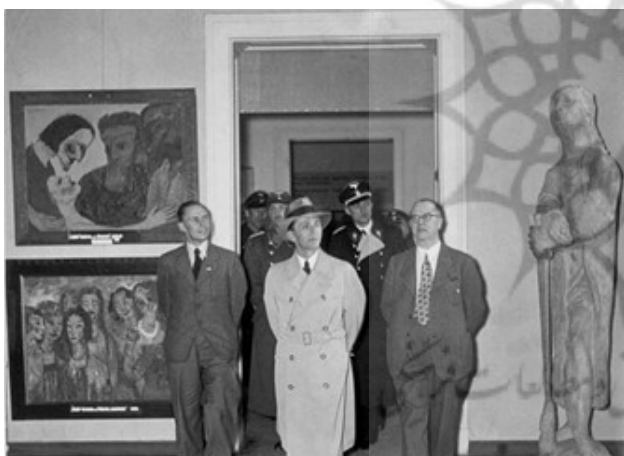
تصویر ۴. یوزف گوبلس. (وزیر تبلیغات آلمان نازی) در حال بازدید از نمایشگاه هنر فاسد در سال ۱۹۳۸

میانۀ جنگ با اثر «حکمت شادان» نیچه آشنا شده بود. آثار نیچه تأثیر عمیقی بر افکار دیکس گذاشت و با مطالعه آثار نیچه همانند او بر این عقیده بود که پس از ویرانی (جنگ) آبادی در راه است (گزارۀ مهم اراده معطوف به قدرت). توجه به رأی مهم نیچه ویرانی و نابودی ارزش‌های کهنه و میان تهی (بنگرید به. ک. غروب بتان) و خلق ارزش‌های جدید که نیاز انسان معاصر را پاسخی درست خواهد داد. ارزش‌هایی جدیدی که اروپا به ویژه آلمان را از انحطاط و فروپاشی نجات دهد و شاید به تعبیر بهتر یافتن ارزش‌های نجات بخش برای از نو سازی فرهنگ و تمدن آلمان که بدان محتاج بود «جنگ چیز وحشتناکی بود، اما چیز فوق العاده‌ای درون آن وجود داشت» (Murray:2021,3) اما چنین حاصل نشود. دیکس به