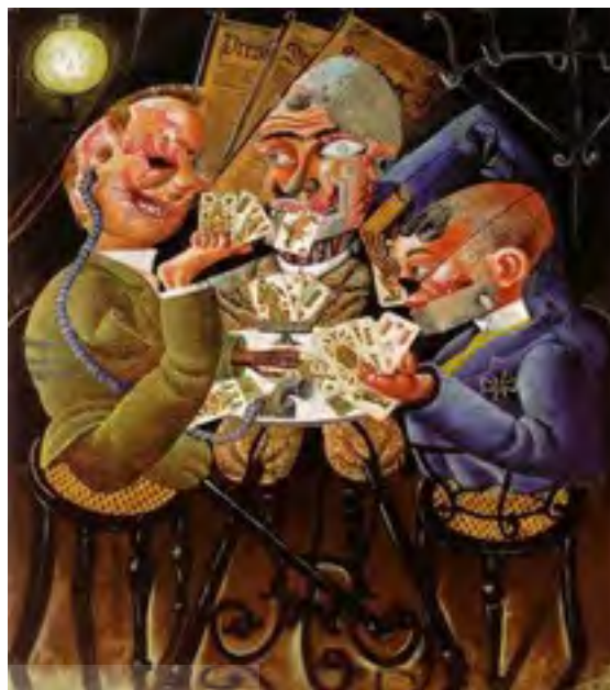
تصویر ۲. نقاشی «یک زیبایی در حال مرگ»