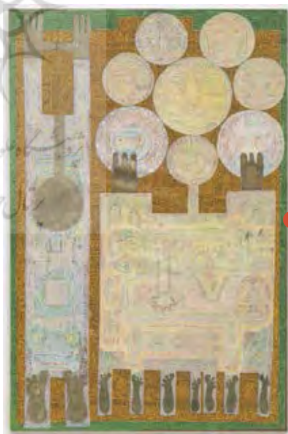
تصویر ۲: من و پدرم، اثر حسین زنده‌رودی، رنگ روغن روی بوم، ۱۹۲۵ م. نصب‌شده روی چوب، ۱۳۴۱ ه.ش، ابعاد: ۱۴۸،۸ * ۲۲۵،۵ سانتی‌متر (www.darz.art).

نقطه یافت. در دهه ۱۳۴۰ و در سال ۱۳۴۱، سومین بینال تهران در حالی برگزار شد که منتقدان و مخاطبان، پیروی از هنر غرب را نمی‌پسندیدند. به همین دلیل، جنبش‌های هنری ملی و مذهبی شکل گرفتند. از نقاشان نوگرایی که سنت و مدرنیست را درآمیختند می‌توان حسین زنده‌رودی (تصویر ۲)، فرامرز پیلارام، صادق تبریزی و ناصر اویسی را نام برد. کریم امامی، بر این گروه از هنرمندان که می‌کوشیدند سنت‌های ملی، مذهبی و نوگرایی را پیوند دهند، مکتب سقاخانه ۸ نام نهاد. استفاده از خوشنویسی و عناصر تزئینی هنر ایران به نوعی آثار هنری را به سمت انتزاع می‌برد.