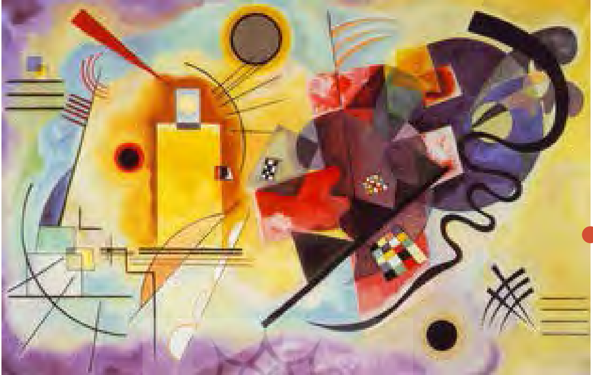
تصویر ۱: زرد- قرمز - آبی، اثر واسیلی کاندینسکی، رنگ روغن روی بوم، ۱۹۲۵ م. ابعاد: ۱۲۷ * ۲۰۰ سانتی متر (www.wassilykandinsky.net).

خویش است و در بسیاری موارد زاینده احساسات ما، در نتیجه، هر دوره فرهنگی، هنر ویژه خود را می‌آفریند که تکرارناشدنی است» (کاندینسکی، ۱۳۸۴، ۳۸). در انتها، برای جمع‌بندی این بخش، لازم است دوباره به این نکته اشاره شود که هنر انتزاعی، محصول تحولات اجتماعی سال‌های ۱۹۱۰-۱۹۲۰ است و یقیناً با آگاهی از آن تحولات، می‌توان معنای هنر انتزاعی غربی را درک کرد.