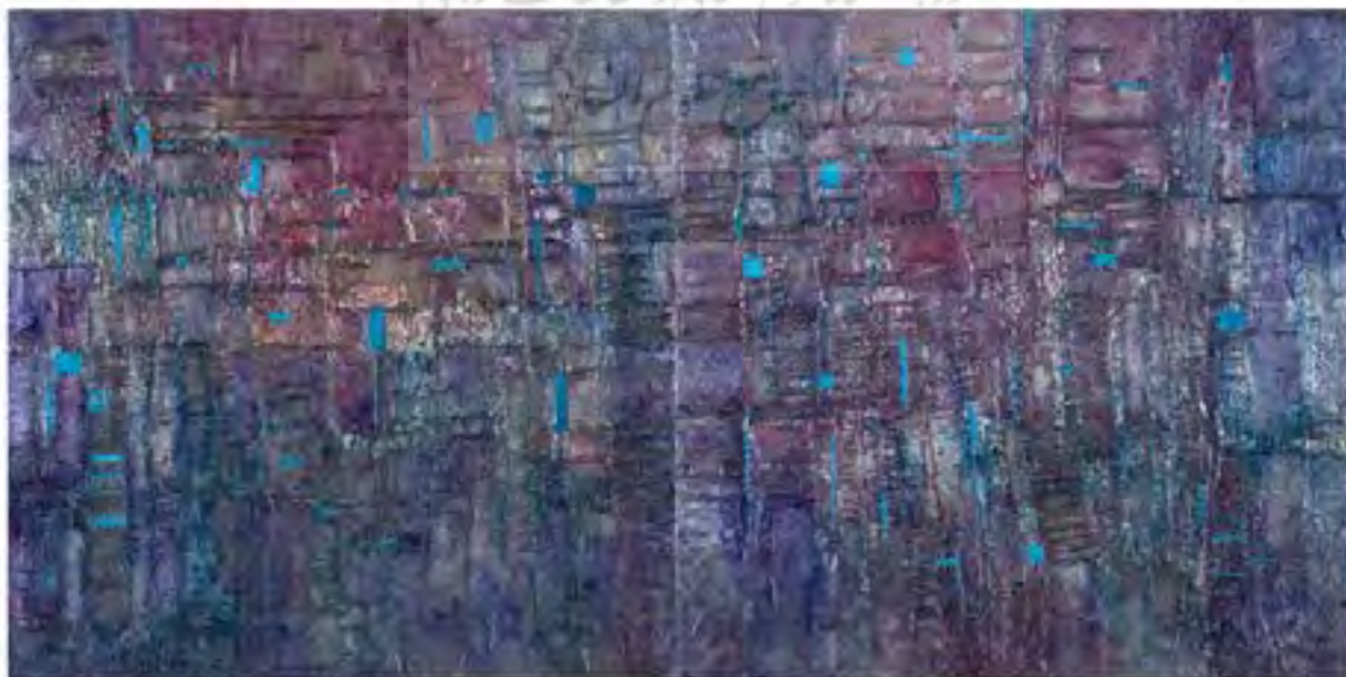
تصویر ۴: بدون عنوان، اثر هادی جمالی، ترکیب مواد روی چوب، ۱۳۹۸ ه.ش، ابعاد: ۱۲۰ * ۲۴۰ سانتی‌متر، ارائه در حراج دی ماه ۱۳۹۹ (www.tehranauction.com)