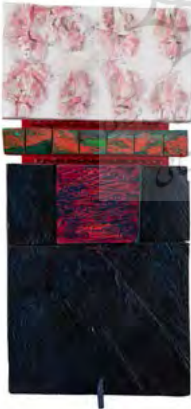
تصویر ۷: از مجموعه ستون‌ها، اثر مهدی سحابی، ترکیب مواد روی چوب، ۱۳۸۰ ه.ش، ابعاد: ۱۸ * ۳۳ * ۷۷ سانتی‌متر، ارائه در حراج دی ماه ۱۳۹۸ (همان).

مهارت و جذابیت آثار این هنرمندان قابل انکار نیست، اما غلبه فرم و فقدان محتوایی که مابه ازای بیرونی و اجتماعی معاصر داشته باشد، نمی‌تواند جایگاهی به عنوان «نماینده هنر دوران» به آنها ببخشد (پورمند و افضل طوسی، ۱۳۹۸، ۳۶). به نظر می‌رسد تمایل به سکوت در آثار هنری ارائه‌شده، بازتابی از شرایط اجتماعی است و هنرمندان، بنا به دلایلی ترجیح می‌دهند در جامعه پرتلاطم امروز، آثاری انتزاعی و غالباً بدون عنوان ارائه دهند. عنوان آثار، از حذف روایت در آثار انتزاعی جلوگیری می‌کند اما در آثار حراج هنری تهران، غالباً آثار انتزاعی فاقد عنوان هستند و همین عامل، این آثار را از تفسیر و خوانش دورتر می‌کند. هم‌چنین، در