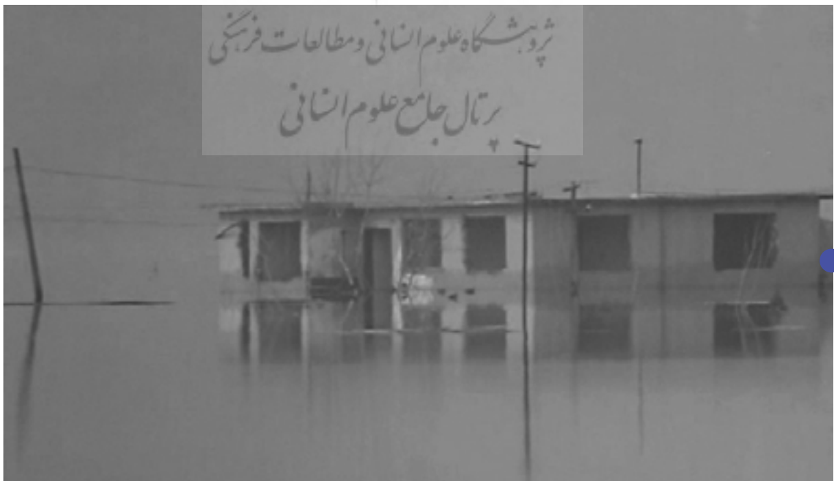
تصویر ۱: صحنه‌ای از فیلم «سفر به خورشید»

به جای انتقاد به سیاست‌های حذفی دولتی که در فیلم‌های «در این دنیا» و «ایست بازرسی» مطرح شد، در فیلم‌های «لامریکا» و «سفر به خورشید»، تمرکز اصلی بر نقصان «عقل سلیم» ملی است؛ منظور، بی‌تفاوتی گروه‌های اکثریت در یک کشور نسبت به مخمصه‌ای است که اقلیت‌ها و مهاجران در آن گرفتار شده‌اند. در «لامریکا»، ما درمی‌یابیم که اسپيرو در اصل میشله تالاریکو یک مرد ایتالیایی است که از آلبانی اشغال شده توسط ارتش موسولینی گریخته است. بعد از اینکه کمونیست‌ها جای ارتش موسولینی را می‌گیرند، میشله برای مدت پنجاه سال زندانی می‌شود و