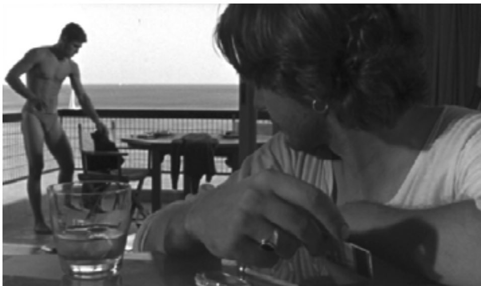
تصویر ۳: صحنه‌ای از فیلم «ایست بازرسی»