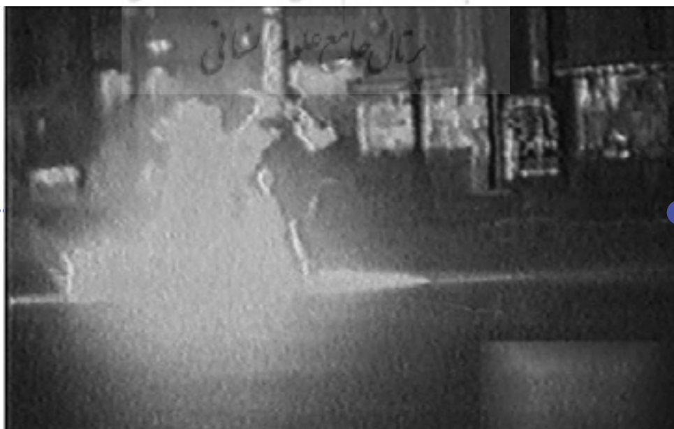
تصویر ۵: صحنه‌ای از فیلم «ایست بازرسی»