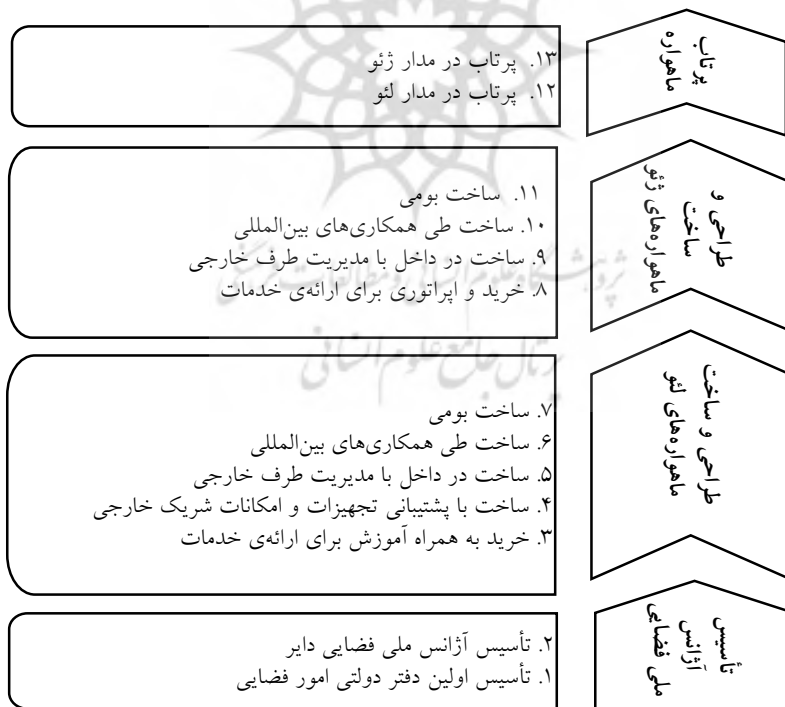
شکل (۲): توالی ارتقاء توانمندی‌های فضایی برای کشورهای در حال توسعه (Wood & Weigel, 2009)

بعد از اکتساب توانمندی در حوزه فناوری‌های طراحی و ساخت ماهواره‌های کوچک در لئو و ماهواره‌های بزرگ در ژئو، این‌گونه کشورها به دنبال سیاست‌های توسعه‌ی فناوری‌های فضایی در حوزه پرتابگرهای ماهواره، ابتدا برای مدار لئو و بعد مدار ژئو هستند. سیاست‌هایی که در این کشورها پایه‌ریزی می‌شوند مبتنی بر خرید یا ساخت ماهواره، ساخت باس ماهواره یا محموله و یا هر دو، اهداف برنامه‌های فضایی، زمان