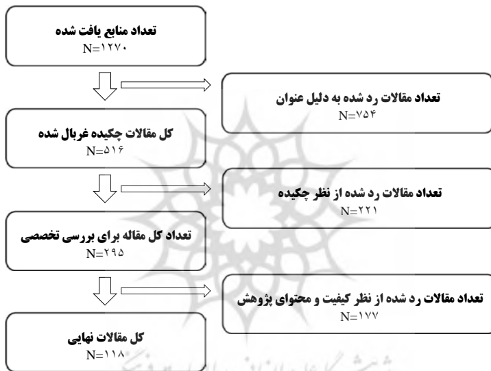
شکل (۲): خلاصه‌ای از نتایج جستجو و انتخاب متون مناسب

۲۹۵ مقاله مذکور از طریق فهرست COREQ 32-item؛ که ابزاری است برای ارزیابی منابع مورد بررسی در روش‌های کیفی؛ (Tong et al, 2007) و به کمک گروه کانونی ۱۵ پژوهش مورد ارزیابی قرار گرفتند و کیفیت آن‌ها در سه دسته بالا، متوسط و ضعیف دسته‌بندی شدند. در این میان، ۳۵ مقاله امتیاز بیش از ۲۸ (سطح بالا)، ۸۳ مقاله بین ۲۲ تا ۲۷ (سطح متوسط) و مابقی نمره زیر ۲۲ (سطح پایین) گرفتند. در نهایت با توجه به معیارهای ذکر شده، ۱۱۸ مقاله (۴۳ مقاله فارسی و ۷۵ مقاله لاتین) مهم‌تر که دارای کیفیت بالا و متوسط بودند، برای استخراج اطلاعات انتخاب گردیدند. مقالات کیفیت بالا با کد H و مقالات با کیفیت متوسط با کد M در جدول (۱) مشخص شده‌اند.