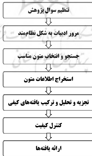
شکل (۱): گام‌های متوالی روش فراترکیب (Sandelowski & Barroso, 2007)

روش فراترکیب در علومی که مطالعات آن بیشتر مبتنی بر تحلیل‌های کیفی است، کاربرد دارد (نقی‌زاده و همکاران، ۱۳۹۳) و از آنجا که مطالعات مرتبط با مفهوم تجاری‌سازی و مدل‌های مربوط، بیشتر پژوهش‌های کیفی و با داده‌های کمی ناچیز و براساس بررسی موردهای مختلف می‌باشند، روش فراترکیب به عنوان روشی مناسب برای به‌دست آوردن ترکیبی جامع از عوامل موفقیت تجاری‌سازی به کارگرفته شده است. برای بهره‌گیری از این روش پژوهشی، روش هفت مرحله‌ای سندلوسکی و باروسو مورد استفاده قرار گرفت (شکل (۱)).