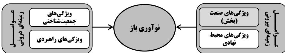
شکل (۱): دسته‌بندی عوامل زمینه‌ای مؤثر بر نوآوری باز (Huizingh, 2011)

به‌طور کلی، صنعت و محیط نهادی دو عامل زمینه‌ای بیرونی مهم به‌شمار می‌آیند. مرور پژوهش‌های پیشین نشان می‌دهد، مطالعاتی در زمینه اتخاذ و کارایی نوآوری باز در صنایعی همچون خودروسازی،