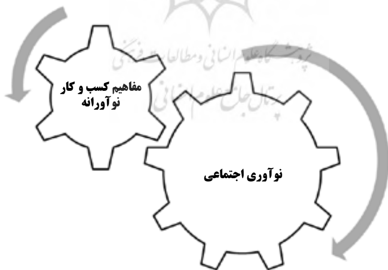
شکل (۱): تعامل کسب‌وکار نوآورانه و نوآوری اجتماعی (Hamerlinck, 2010)

امروزه، هیچ توافق قطعی و مشترک در مورد اصطلاح نوآوری اجتماعی وجود ندارد و طیف وسیعی از