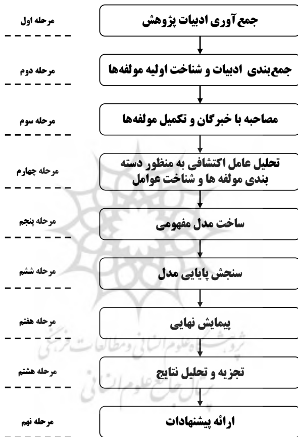
شکل (۱): مدل مورد بررسی پژوهش

در شکل (۱) روند انجام پژوهش نمایش داده شده است. همانطور که مشاهده می‌شود، مرحله پنجم از فرآیند انجام پژوهش، مرحله ارائه مدل مفهومی است. پیش از آن، در جدول (۲) عوامل مؤثر بر شکل‌گیری شبکه‌های نوآوری که حاصل مطالعات کتابخانه‌ای و مصاحبه‌های نیمه‌ساختار یافته با خبرگان این حوزه مرور می‌شوند.