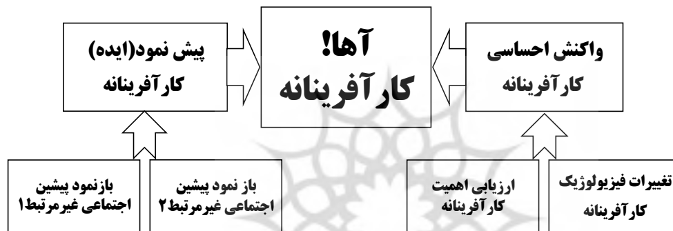
شکل (۱): همگشت‌های تجربه آنها! کارآفرینانه

بر این اساس، پیش‌نمود (ایده) کارآفرینانه محصول ترکیب بازنمودهای کارآفرینانه می‌باشد. در ذهن کارآفرین، از یک سو بازنمودهای اجتماعی غیرمرتبط با هم ترکیب می‌شوند و پیش‌نمود (ایده محصول) کارآفرینانه را تولید می‌کنند و از سوی دیگر تغییرات جسمانی کارآفرین و ارزیابی اهمیت کارآفرینانه با یکدیگر ترکیب و منجر به تولید واکنش احساسی کارآفرین می‌شوند. در نهایت، ترکیب پیش‌نمود کارآفرینانه و واکنش احساسی کارآفرینانه، تجربه آنها! کارآفرینانه را به دنبال خواهد داشت. پیش‌نمود کارآفرینانه با واکنش احساسی کارآفرینانه همراه خواهد بود که نتیجه همگشت ارزیابی، اهمیت کارآفرینانه و تغییرات جسمانی کارآفرینانه است. همچنین، ارزیابی اهمیت در همگشت کارآفرینانه (ارزیابی اهمیت کارآفرینانه)، به کارکردهای اجتماعی و ارزش اقتصادی مورد انتظار از پیش‌نمود، وابسته است (شکل (۱)).