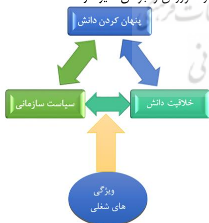
شکل ۱: مدل مفهومی پژوهش

لذا پژوهش حاضر به دنبال پاسخگویی به این سوال است که آیا سیاست سازمانی بر خلاقیت کارکنان از طریق پنهان کردن دانش با نقش تعدیل‌گر ویژگی‌های شغلی در بین کارکنان وزارت ورزش و جوانان تأثیر دارد؟