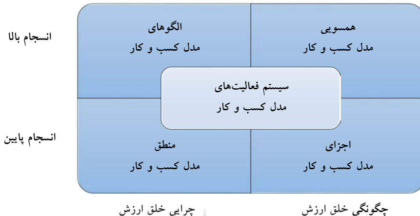
شکل ۱- دیدگاه‌های پژوهش در مدل کسب و کار