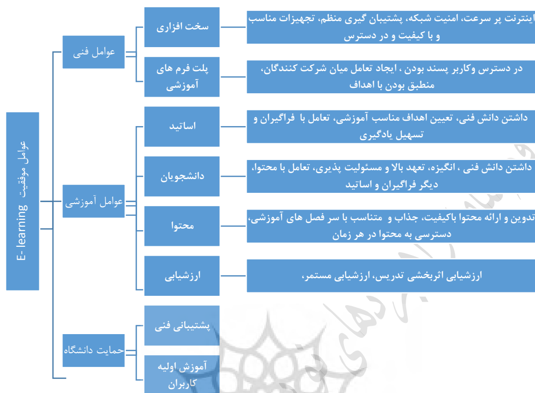
شکل ۳. فاکتورهای حیاتی موفقیت برای آموزش الکترونیکی (محمدی چمردانی و رحمانی، ۲۰۱۹).