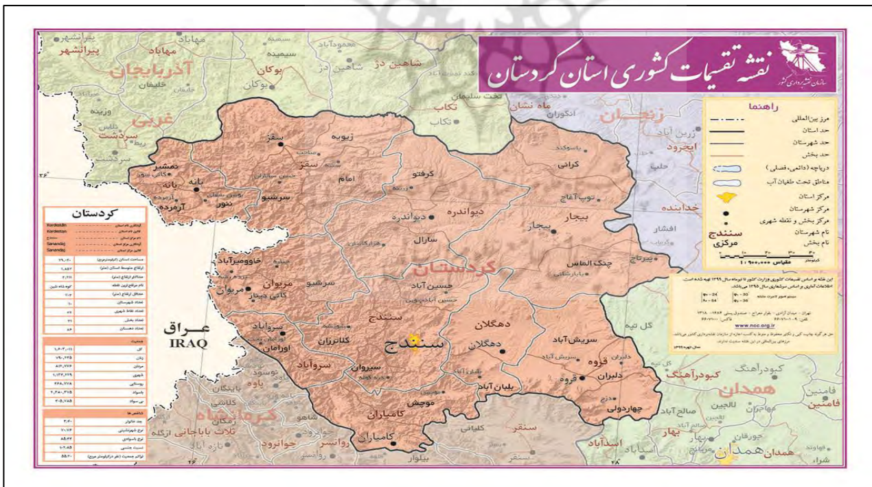
شکل ۲. نقشه استان کردستان

موقعیت طبیعی و ویژگی جغرافیای منطقه از قبیل کوه های مرتفع، آبشارها و رودهای خروشان، شکارگاه ها و غارهای طبیعی از یکسو و از سوی دیگر: آئین ها، آداب و رسوم، قلعه های مستحکم، تپه های باستانی، اماکن و عمارت های باستانی مانند حمام، خانه ها، کاروانسراها، روستاهای پلکانی با معماری منحصر به فرد، مراکز صنایع دستی و محلی فرش، گلیم، شال، گیوه، نازک کاری و... که تنها گوشه ای از غنای طبیعی، تاریخی، فرهنگی و هنری کردستان است] به این استان جاذبه های فراوانی بخشیده است که در نوبه خود، هریک از این جاذبه ها می تواند زمینه های لازم را برای گردش، تفریح، کوهنوردی، صید و ... فراهم آورد ( کرمی و همکاران، ۱۳۹۹).