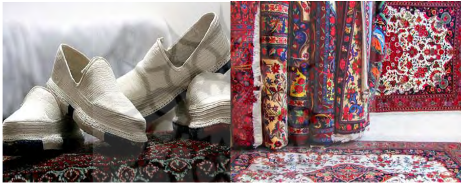
شکل ۱: نمونه هایی از صنایع دستی کردستان

سایر صنایع دستی استان عبارتند از: زرگری سنتی، سفالگری، ساخت مصنوعات چرمی، کاردووزی و خراطی.