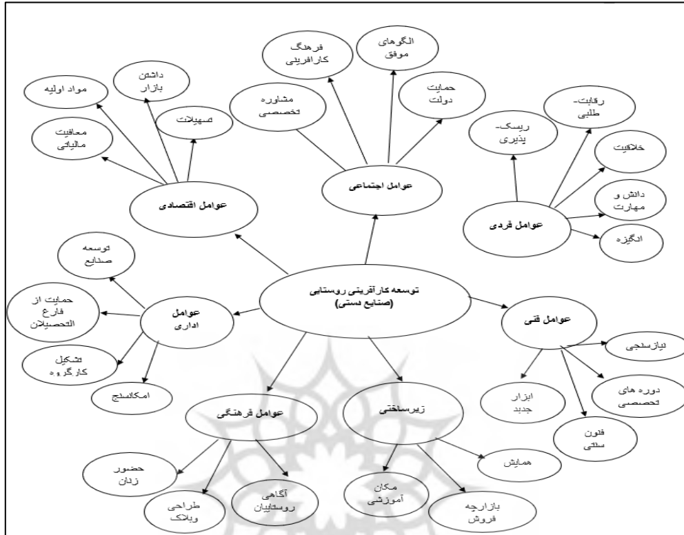
شکل ۳. مدل توسعه کارآفرینی روستایی استان کردستان

نهایتاً با توجه به اجرای رویکرد نظریه بروان و کلارک و تحلیل نتایج از تحلیل داده‌ها، مدل نهایی تحقیق به شرح شکل ۳ تعیین گردید.