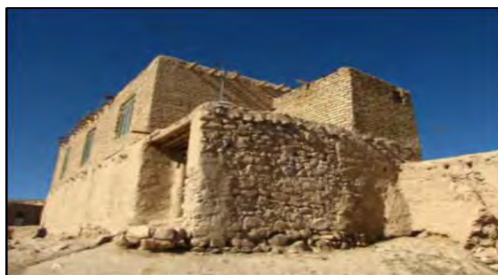
شکل ۵. نمونه‌ای از ابنیه در روستا

ابنیه نوساز: ساختمان‌هایی که بدون نیاز به مرمت قابل بهره‌برداری می‌باشند. تعداد بناهای نوساز در روستای مورد مطالعه ۲۷/۵ درصد رابه خود اختصاص داده‌اند.