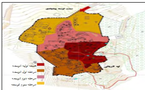
شکل ۳. روند توسعه روستا

معابر روستا از توپوگرافی روستا تاثیر گرفته و طویل، باریک بوده است و این معابر درجه دو که به درجه یک متصل می‌شود ارتباط بین روستا را برقرار و براساس شیب منطقه؛ بیشتر از جنوب غربی به شمال شرق تمایل دارد.