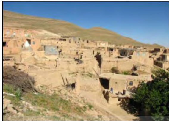
شکل ۶. نمایی از بافت مسکونی روستا

ابنیه مرمتی و قابل نگهداری: ساختمان‌هایی که برای بالا بردن عمر آنها با توجه به استانداردهای واحدهای مسکونی باید در آن تغییراتی ایجاد گردد. بر این اساس در روستای مورد مطالعه ۳۱/۷۶ درصد را به خود اختصاص داده‌اند. ابنیه تخریبی (غیر قابل سکونت): این نوع بناها روستا ۴۰/۷۴ درصد کل بناهای موجود می‌باشد و به لحاظ کیفیت تخریبی بود لازم است تخریب و مجدداً ساخته شوند. مصالح مصرفی از آجر، خشت و گل استفاده شده است.