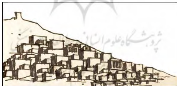
شکل ۷. شکل‌گیری بافت بر روی شیب

ناهمواری‌های جغرافیایی و شرایط اقلیمی در مکانیابی، سیما و بافت سکونتگاه‌ها تاثیر تعیین کننده دارد، سستی یا سختی زمین، شیبدار یا مسطح بودن بستر روستا، وجود رود یا مسیل از عوامل تاثیرگذار بر استقرار، شکل، بافت مسکن، حدود گسترش و توسعه فیزیکی روستاها تاثیرگذار است. (سرتیپی‌پور، ۱۳۸۸: ۱۵). بشر همواره پیوندی ناگسستنی با طبیعت داشته به طوری که با حذف آن در محیط مسکونی خود، به ناچار در جایی دیگر به جستجوی آن می‌پردازد، نگاه کردن به فضای سبز از جمله عواملی است که مورد علاقه مردم در محیط‌های مسکونی است. (ببیر، ۱۳۸۱: ۴۲). ناهمواری‌های زمین در نحوه جاگیری کلی بافت مسکونی و انتظام فضای باز آن تاثیر بسیاری دارد. بافت مناطق کوهستانی به گونه‌ای است که معابر و فضاها به صورت فشرده، گذرها و معابر کم عرض، نامنظم و گاه سرپوشیده‌اند محصور بودن معابر توسط دیوارهای بلند، که گاه با ساباطها پوشانیده می‌شود در ایجاد آسایش