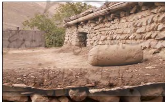
شکل ۱۱. نمونه‌ای از سقف مسکن روستایی

در اقلیم سرد، مصالح به رنگ تیره و سطح زبر و ناصاف بکار می‌رود تا در زمستان گرمای مورد نظر را از تابش آفتاب به نحوی مطلوب در بدنه دیوارها جذب و به تدریج به داخل فضاها انتقال یابد. برای تعیین بهترین شکل ساختمان که کمترین مقدار حرارت را در زمستان از دست دهد و در تابستان نیز کمترین حرارت آفتاب را از محیط کسب کند، ساختمان پلان مربعی شکل دارد زیرا چنین شکلی کمترین سطح خارجی را در برابر بیشترین حجم خارجی دارد. (قبادیان، ۱۳۷۰: ۵۳)