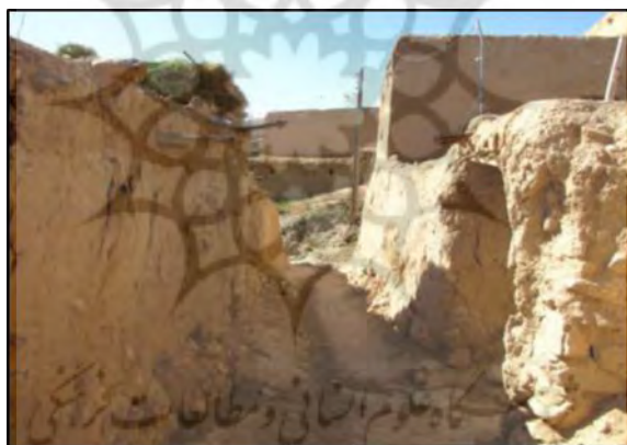
شکل ۴. نمونه‌ای از معابر روستا

ابنیه در حال ساخت: ابنیه در حال ساخت در روستای حاجی کاهو وجود ندارد.