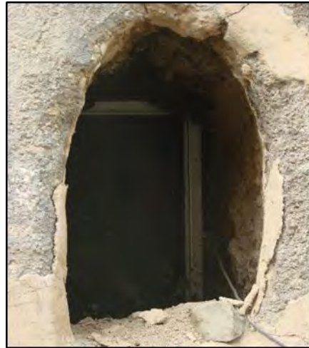
شکل ۱۰. نمونه‌ای از بازشو مسکن روستایی

خشت خام وقتی خشک و سفت می‌شوند خواص فیزیکی‌اش دگرگونی ایجاد می‌شود. پس یک فرم و فضا برای ساختمان خشتی ایجاد می‌کند. (فتیحی، ۱۳۸۲: ۳۲) سنگ و چوب از مصالح بکار رفته در مناطق کوهستانی محسوب می‌شود که چوب در سقف‌های صاف و سنگ در پی ساختمان استفاده شده و از چوب که خود به عنوان جاندار بحساب می‌آید، می‌تواند باعث آرامش بیشتر در زندگی و از لحاظ روانی در ساختمان‌ها باعث روح و ارزش دادن به مسکن گردد. (فلامکی، ۱۳۸۷: ۷۱)