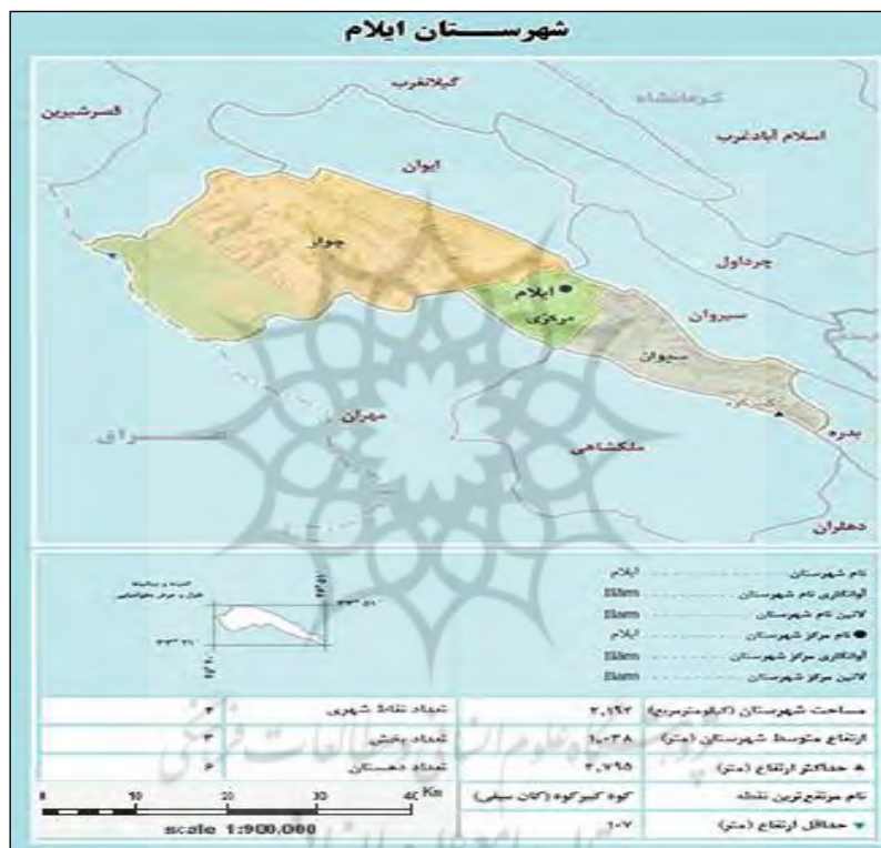
شکل ۱- اطلاعات شهرستان ایلام

وچرداول، دره شهر، مهران و کشورعراق همسایه است. گویش مردم شهرستان، کردی فیلی می باشد. این شهرستان دارای دو بخش و چهار دهستان است. ایلام در عهد باستان به "اریوجان" معروف بود ولی ایلام کنونی در سال ۱۳۰۸ شمسی در منطقه‌ای که حسین آباد نامیده می‌شد، از نو احداث گردید. شهر ایلام در حصار از کوه ها و ارتفاعات جنگلی استقرار یافته که دارای آب و هوای معتدل کوهستانی با میانگین بارش سالانه ۵۸۰/۸ میلیمتر و متوسط دمای مطلق آن از ۱۳/۶- تا ۴۲ درجه سانتیگراد در تغییر است. ارتفاع این شهر از سطح دریا ۱۳۶۳ متر است، این شهر در دره ایی کوهستانی و در دامنه جنوبی کبیر کوه از سلسه جبال زاگرس واقع شده است (ملکی، ۱۳۹۰: ۱۳۰). سیستم‌های جوی مختلفی مانند توده هوای غربی از دریای مدیترانه و دریای سیاه، جریانات سودانی و دریای سرخ و صحرای عربستان، وتوده‌های شمالی که از مناطق سیبری به ترتیب باعث بارندگی در پاییز و زمستان، کاهش رطوبت در تابستان و یخبندان در شمال استان می‌گردند (تقوایی و همکاران، ۱۳۹۱: ۴۲).