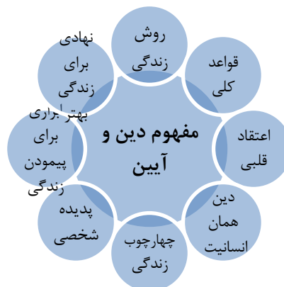
شکل ۱-۱ مفهوم دین و آیین

با توجه به تعریف دین و آیین که در ذیل آیین بیان شد و همچنین تعاریفی که از سوی مشارکت کننده ها در این تحقیق ارائه شده است، می توان گفت که جنبه کاربردی و عملی دین و آیین جلوه گر بوده است و باید ها و نبایدها و قوانینی که برگرفته از یک دین و آیین است بیشتر معرف آن می باشد. مثلا شرکت کننده الف برای معنای دین و آیین نوشته: دین یعنی روش زندگی برای رسیدن به مقصد نهایی، و یا شرکت کننده ب: بنظم دین و آیین یعنی داشتن یه سری قواعد کلی که باید بهشون پایدار بود و نباید هر جا به نفعت باشه پیروی کنی هر جا به ضررت باشه عمل نکنی. و نظر سایر شرکت کننده ها که در شکل ۱-۱ طبقات توصیفی آن آمده است.