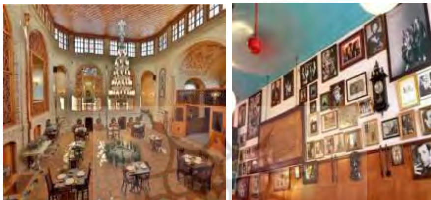
شکل ۲: رستوران های جامعه هدف ( بدون ذکر نام)

برخی از رستوران‌ها و کافه‌های مورد مطالعه شامل موارد زیر است: کافه مسعودیه، رستوران ملک التجار، کافه تهرود (باغ نگارستان) باغ موزه هنر ایرانی، کافه رومنس، کافه و هتل نادری، کافه مارکوف، رستوران ری، کافه رستوران گل رضاییه و رستوران دهه شصت (جمشیدیه). برای نمونه‌گیری در این پژوهش از روش نمونه‌گیری غیر احتمالی «نمونه در دسترس» استفاده گردید. همچنین برای انتخاب رستوران‌های نوستالژیک از سه شاخص برند رستوران، اتمسفر و طراحی (داخلی و نمای بیرونی) استفاده شده است. ابزار گردآوری داده‌ها در این پژوهش، در بخش کیفی مصاحبه عمیق و در بخش کمی پرسشنامه بوده است. روش تحقیق استفاده شده در بخش کیفی، رویکرد پدیدارشناسی توصیفی زیست جهان تأملی داهلبرگ و همکاران هست. رویکرد استفاده شده در مصاحبه عمیق طبق دیدگاه داهلبرگ و همکاران، رویکرد باز بوده است (Dahlberg et al, 2008). تحلیل مصاحبه‌های انجام شده بر اساس روش پدیدارشناسی توصیفی، بر اساس رویکردی باز می‌باشد و از یک رویکرد کل-اجزا-کل پیروی می‌کند که محققین زمانی که یک متن را برای به دست آوردن