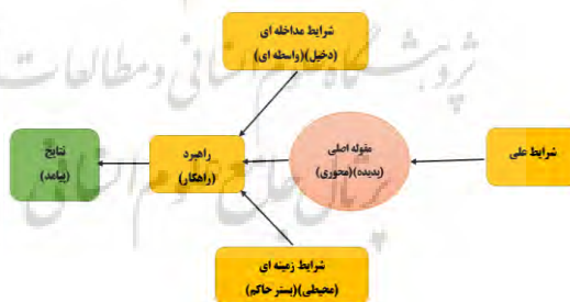
شکل ۱: مدل پارادایمی (Filick., 2018)