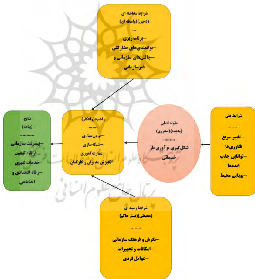
شکل ۳: مدل نهایی پژوهش