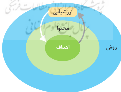
شکل ۱. مدل مفهومی مبتنی بر برنامه درسی

در این پژوهش در نظر بوده است یافته‌های پژوهش به دفتر تألیف کتب درسی وزارت آموزش و پرورش ارائه شود، بنابراین در آن جایگاه عناصر موجود در یک برنامه درسی، تعریف و ارائه شده است. رایج‌ترین دیدگاه در زمینه عناصر یا اجزای برنامه درسی، سند برنامه درسی یا یک برنامه درسی خاص را در بردارندهٔ تصمیم در خصوص چهار عنصر اهداف، محتوا، روش (یاددهی - یادگیری) و ارزشیابی قلمداد می‌کند (گودلاد ۲ ، ۱۹۸۵؛ به نقل از مهرمحمدی و همکاران، ۱۳۸۸: ۱۲). هرچند نتایج ارزشیابی می‌تواند میزان کارایی و اثربخشی فرایند تدریس را نشان دهد، اما در مسیر طراحی مدل - با فرض اولیه اعمال ارزشیابی ترکیبی مستمر و پایانی (مستمر؛ در طول دوره آموزش و پایانی؛ بررسی میزان تحقق‌پذیری اهداف رفتاری دانش‌آموز در موقعیت در پایان دوره)، دربارهٔ این عنصر برنامه درسی (ارزشیابی) و چگونگی انجام دادن آن، نیاز به بررسی پژوهشی خاصی تشخیص داده نشده است. در عوض، کشف و ارائه ریزمؤلفه‌های سه عنصر محتوا، روش و اهداف آموزشی و پرورشی سواد رسانه‌ای به دانش‌آموزان دوره ابتدایی، اجزای سه‌گانه اهداف پژوهش را تشکیل داده است که کلیات و عناوین این مفاهیم، در مدل مفهومی مبتنی بر برنامه درسی نمایش داده شده است.