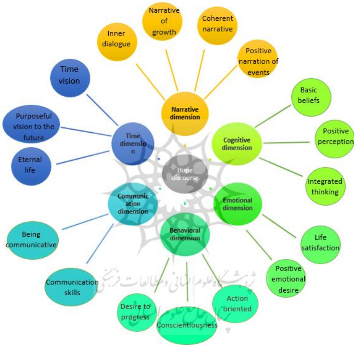
Figure 1. The sharing-based hope discourse model

answers became repetitive. When 95% of the answers became repetitive, the interviewer stopped after interviewing 3 other people, ending to a sample size of 16 people.