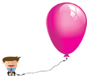
مجله روان‌پزشکی و روان‌شناسی بالین ایران