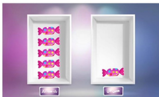
مجله روان‌پزشکی و روان‌شناسی بالین ایران

با هر بار باد شدن بادکنک، ۵۰ تومان پول به ذخیره یک صندوق موقتی اضافه می‌شود. هنگامی که بادکنک بیش از یک مقدار مشخص باد شد، با صدای «پاپ» (پخش از بلندگوهای رایانه) ترکیب و ناپدید می‌شود. هرگاه بادکنکی بترکد، پول ذخیره‌شده در صندوق موقتی از دست می‌رود. شرکت‌کننده می‌تواند در هر مرحله آزمون به جای باد کردن بیشتر بادکنک، با فشردن دکمه دیگری که در صفحه نمایش نشان داده شده است، پول ذخیره‌شده در صندوق موقتی را به صندوق اصلی