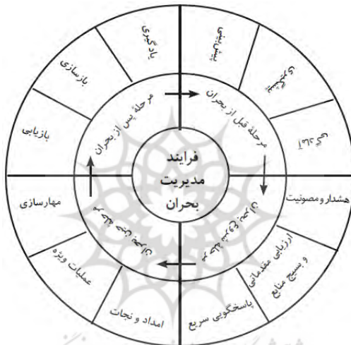
نگاره (۱): الگوی چرخشی شکل مدیریت بحران، (روشندل اربطانی، پورعزت و قلی‌پور، ۱۳۸۸، ص ۷۳).

الگوی جامع مدیریت بحران؛ این الگو را روشندل اربطانی ، پورعزت و قلی‌پور ، بر مبنای چرخه حیات بحران و نیز مراحل آن ارائه داده‌اند که نمودار آن در ذیل ارائه می‌گردد.