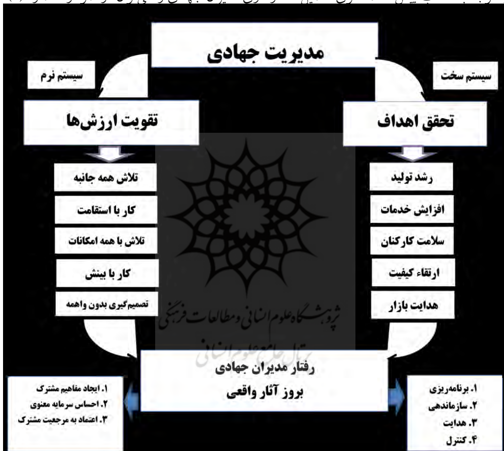
نمودار شماره ۱ - الگوی مدیریت جهادی

با توجه به مطالب پیش گفته، الگوی تکمیل شده رفتاری مدیران جهادی را می‌توان در نمودار شماره (۲)