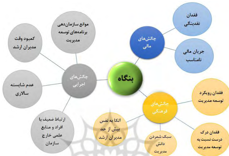
شکل ۳. موانع (مؤلفه‌ها و زیرمؤلفه‌های) پیش‌روی توسعه مدیریت در سطح بنگاه در شرکت‌های دانش‌بنیان

برای فائق آمدن بر چالش‌های فرهنگی و اجرایی در سطح بنگاه ایجاد یک بخش تخصصی در شرکت‌ها و محول کردن امور مربوط به توسعه مدیریت به این بخش است.