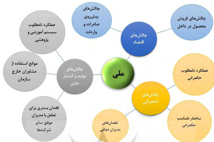
شکل ۴. موانع (مؤلفه‌ها و زیرمؤلفه‌های) پیش‌روی توسعه مدیریت در سطح ملی در شرکت‌های دانش‌بنیان

آگاهی و دانش مدیران دولتی‌ای که به‌طور متمرکز روی توسعه مدیریت شرکت‌های دانش‌بنیان تصمیم‌گیری می‌کنند خواهد شد.