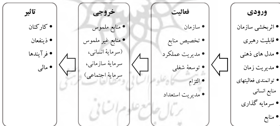
شکل ۱. زنجیره‌ی ارزش مدیریت سرمایه‌ی انسانی (اینگهم، ۲۰۰۶)

سنگ‌بنای مدل مدیریت سرمایه‌ی انسانی دیوان خزانه‌داری آمریکا (۲۰۰۲) ۱ بر چهار اصل: رهبری، استمرار و طرح جانشینی، برنامه‌ریزی راهبردی منابع انسانی و هم‌سوسازی، جذب و توسعه کارکنانی که توانمندی‌ها و مهارت‌هایشان منطبق با نیازهای سازمان می‌باشد استوار است. ایجاد فرهنگ نتیجه‌محوری در سازمان که این معیارهای اساسی خود به هشت زیرعامل، موسوم به معیارهای اساسی موفقیت تقسیم می‌شوند. اینگهم ۲ ، (۲۰۰۶) در کتابی تحت‌عنوان «مدیریت راهبردی سرمایه‌ی انسانی» مدیریت سرمایه‌ی انسانی را به صورت زنجیره‌ای معرفی می‌نماید (شکل ۱) که در نهایت برای سازمان ایجاد ارزش می‌کند.