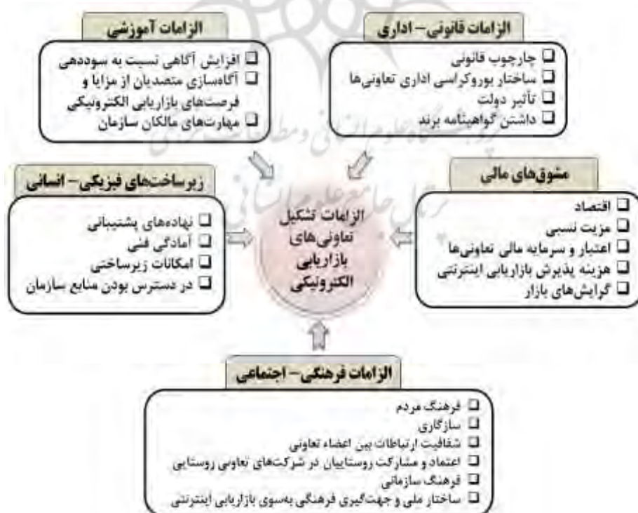
شکل ۱: چهارچوب مفهومی پژوهش

دسته‌اند. نخست، مطالعاتی که در زمینه عوامل مؤثر بر تشکیل تعاونی‌ها انجام شده است؛ دسته دوم مرور پژوهش‌هایی که به موضوع بازاریابی الکترونیکی در ایران و خارج از آن پرداخته‌اند. برخی مطالعات بر الزامات قانونی-اداری برای توسعه بازاریابی الکترونیکی تأکید دارند. در این راستا، می‌توان به کلیدواژه‌هایی چون چهارچوب قانونی، ساختار بروکراسی اداری تعاونی‌ها، تأثیر دولت و داشتن گواهینامه برند در این مطالعات اشاره کرد. در بخشی از پژوهش‌ها الزامات آموزشی شامل مواردی چون افزایش آگاهی درباره سوددهی، آگاه‌سازی متصدیان از مزایا و فرصت‌های بازاریابی الکترونیکی، مهارت‌های مالکان سازمان مورد توجه پژوهشگران قرار گرفته است. زیرساخت‌های فیزیکی-انسانی از جمله دیگر مواردی است که در مرور مطالعات قبلی در اصطلاحاتی چون نهاده‌های پشتیبانی، آمادگی فنی، امکانات زیرساختی و دردسترس بودن منابع سازمان،