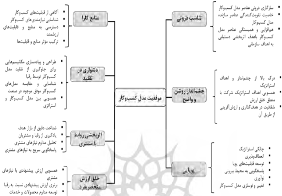
شکل شماره ۱: عوامل مؤثر بر موفقیت مدل کسب‌وکار

شکل شماره ۲ مدل ساختاری را که به کمک نرم افزار Amos استخراج شده است با ذکر ابعاد و مولفه‌ها با ضریب استاندارد بارعاملی نشان می‌دهد.