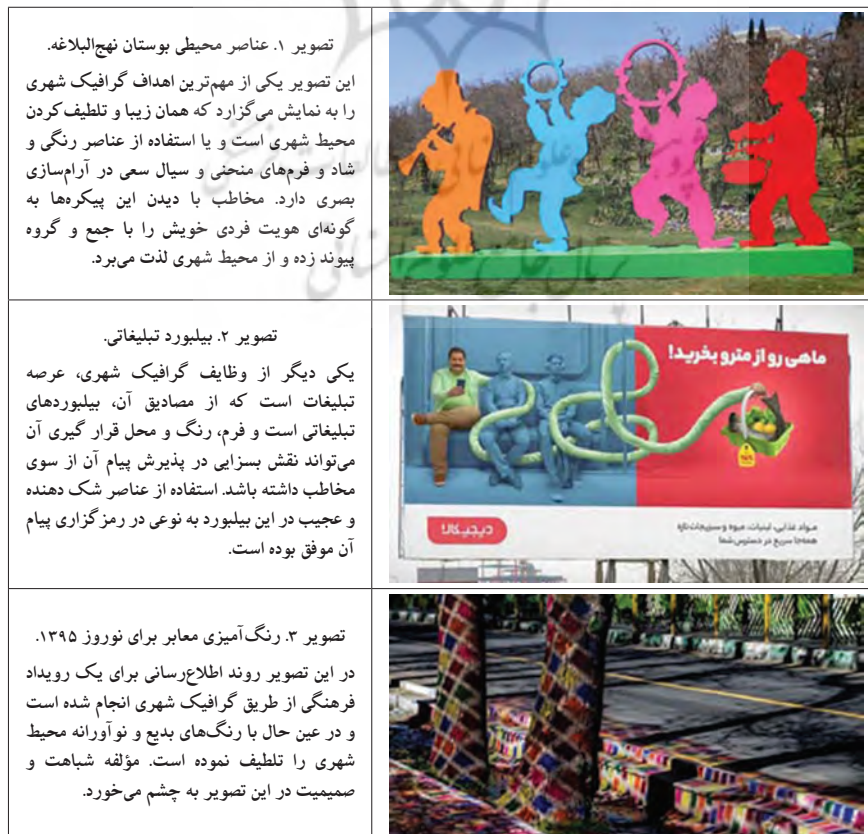
جدول ۴. نمونه‌هایی از گرافیک محیطی شهر تهران.

۴) با گرافیک شهری، توسعه آثار هنری و تجارب تجسمی هم در