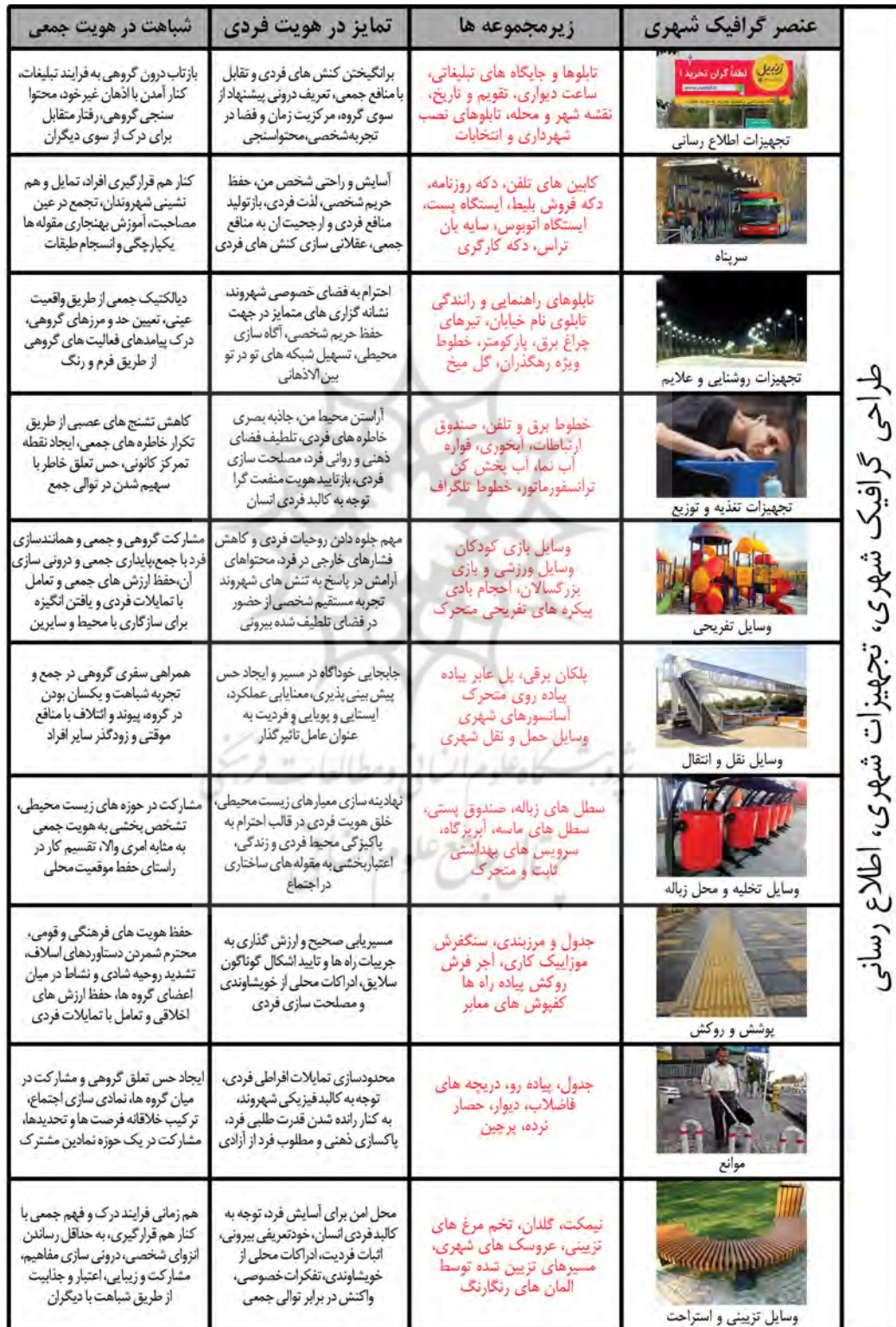
جدول ۶. تحلیل انواع عناصر گرافیک شهری بر اساس شباهت‌ها و تفاوت‌های هویتی.

طراحی گرافیک شهری، تجهیزات شهری، اطلاع‌رسانی