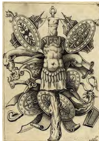
تصویر ۸- گروتسک با ابزار و نشان‌های پیروزی جنگی، گراور، اناویکو، ۱۷x۲۴ سانتی‌متر، مجموعه‌ای که به اناویکو منسوب است و شامل ۱۶ صفحه بوده و غنایم اسلحه و ابزار جنگی را نشان می‌دهد. برخی از چاپ‌های این مجموعه دارای نام و تاریخ‌های ۱۵۵۰ و ۱۵۵۳ میلادی است.

۱۱. John Florio (۱۵۵۳-۱۶۲۵ میلادی)، واژه‌شناس، زبان‌شناس، مترجم