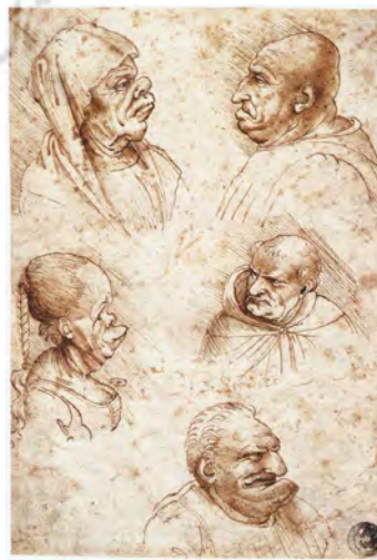
تصویر ۴. پنج سر کاریکاتوری گروتسک، لئوناردو داوینچی، ۱۴۹۰ میلادی، قلم و مرکب روی کاغذ، ۱۸×۱۲ سانتی متر، گالری دل آکادمیا، موزهٔ هنر ونیز.

باراش به گفته باتیستا آلبرتی اشاره می‌کند، در جایی که وی می‌گوید مهم‌ترین اصولی که باید در خاطر داشت این است که: «جهان در هماهنگی مطلق ریاضی ایجاد شده است. جهان به عنوان یک فرم هندسی کامل تصور شده است و اینکه بخش‌های متناظر آن -ستارگان، کره زمین، درختان، انسان، همهٔ طبیعت- بر اساس دایره شکل گرفته‌اند، کامل‌ترین شکل هندسی» (Barasch, 2013: 25). در واقع ایده‌های آلبرتی بر گروهی از انسان‌گرایان دوره رنسانس تأثیر گذاشته بود که سبک بی‌قاعده، نامتناسب، عجیب و خارق‌العاده فانتزی تزئینات گروتسک را محکوم می‌کردند و اصطلاح گروتسک را مترادف با ضد ویتروویانیسم می‌دانستند (Ibid.: 30). تحول نگرش متفاوت نسبت به گروتسک تحت تأثیر نوشته‌های جورجیو وازاری ۲۹ بود که در کتاب‌های خود (۱۵۵۰ و ۱۵۶۸) این اصطلاح را برای مشخص نمودن