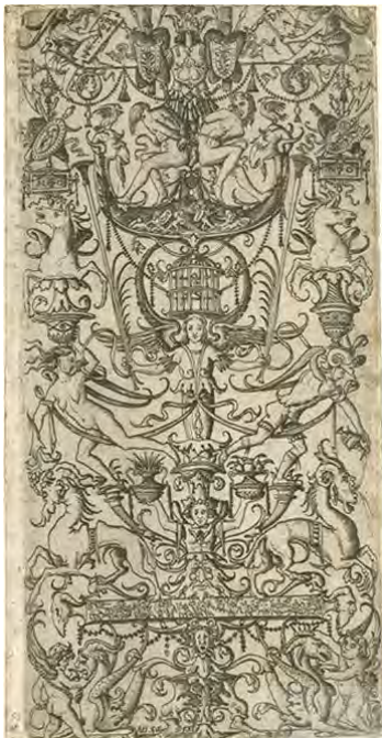
تصویر ۱۰. گراور طرح‌های گروتسک بر روی کاغذ، نیکولتو دامودنا، حدود ۱۵۰۰-۱۵۱۲ میلادی، موزهٔ ویکتوریا و آلبرت.

ت رسید. از طرف دیگر، باختین گروتسک را شیطانی می‌داند، و معتقد است که همه خنده‌ها اهریمنی است و از سقوط بشریت به وجود آمده است. بنابراین، دیدگاه او جنبهٔ کارناوال را می‌گیرد، ایده‌ای که برگرفته از فرهنگ جشن‌های دموکراتیک و مردمی قرون وسطی است، و در آن همه جنبه‌های قلمرو مادی و زمینی به‌طور موقت دیده می‌شوند. اما در نقاشی‌ها (به‌ویژه در دورهٔ رنسانس) به دلیل استفاده از وجه بصری گروتسک و مفاهیم قبلاً تعریف شدهٔ آن در قالب‌های استعاره‌ای و نمادین، اختلاف نظرات بر سر مفهوم گروتسک کمتر است، و یکی از گواهان این ادعا را شاید بتوان در تکرار عناصر استفاده‌شده در آثار دانست. گروتسک در آثار تصویری (نقاشی‌ها، تزیینات، گچ‌بری‌ها، گراورها و غیره) رنسانس قرون پانزدهم و شانزدهم میلادی اغلب شامل نوعی تلفیق و ترکیب انسان با حیوانات، گیاهان، اشیاء، عناصر طبیعت یا ترکیبات دیگر است. جلوه دیگری از این امر، ترکیبی از پرتله‌های کاملاً طبیعت‌گرایانه از گل‌ها یا حیوانات خاص با ابداعات خارق‌العاده است که در تخیل هنرمند ایجاد شده است. این ترکیبات و دگرپس‌ها در طول قرون مورد توجه هنرمندان بوده است.