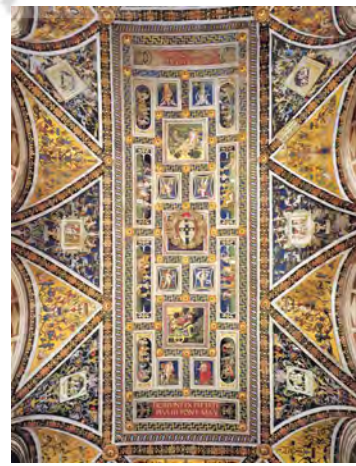
تصویر ۶. بخشی از تزینات سقف کتابخانه پیکولومینی، پینتوریکو، ۱۵۰۲-۱۵۰۳ میلادی، سی‌ینا.