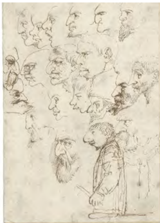
تصویر ۵. طرح‌های اولیه کاریکاتوری از هنرمندان مشهور زمان کاراچی توسط آنیباله کاراچی، اواخر قرن شانزدهم میلادی.

«استفاده از اصطلاح گروتسک که در قرن شانزدهم میلادی به ادبیات و به‌ویژه در کاریکاتور گسترش می‌یابد، باعث می‌شود که کایزر آن را "از دست دادن ماده در واژه" بنامد» (Hollington, 1984: 13). کایزر به نقل از کریستف مارتین ویلاندا بین سه گونه از کاریکاتور تمایز