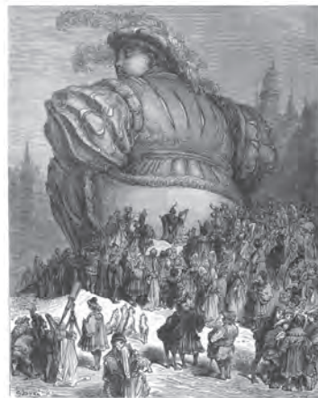
تصویر ۳. تصویر سازی کتاب گارگانتوا و پانتاگروئل ، گراوور روی چوب، گوستاو دوره، ۱۸۷۳ میلادی.

میخائیل باخنین فیلسوف، ادیب و نویسنده روس علاقه وافری به اندیشه‌ها و بینش رابله داشت. وی تمایل زیاد خود به گروتسک و کارناوال‌گرایی را در آثارش نشان داده است. باخنین آثار تأثیرگذاری در حوزه نقد و نظریه ادبی و بلاغی نوشته است. آثار او که به