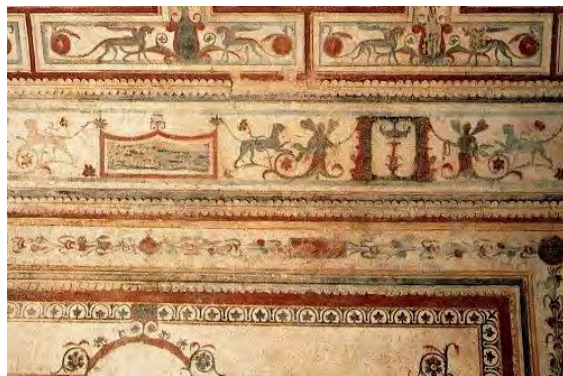
تصویر ۷. تزینات گروتسک نقاشی دیواری‌های داموس اورنا، کاخ نرون، سده اول میلادی.

گروتسک‌ها به عنوان نوعی خودنمایی هنری مبتنی بر نیروی خلاقانه