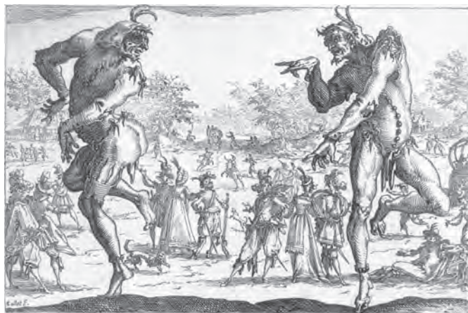
تصویر ۱. دو مسخره‌باز، ژاک کالو، تکنیک اچینگ، ۱۶۱۶ میلادی، موزه بریتانیا. منبع: (www.artic.edu/artworks)

«این امر باعث تغییر در معنای کلمه گروتسک شد که شروع به تشخیص بخشیدن به ژانر ادبیات مضحکه و خنثی