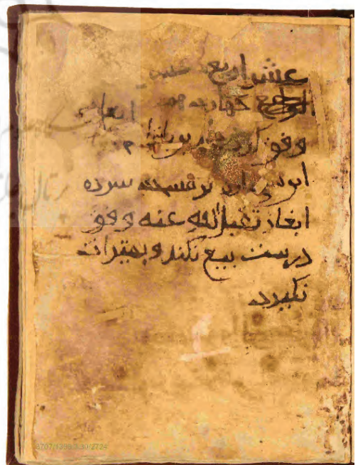
آغاز جزوه ۳۰۴۴: «أربع عشر چهاردهم | وقف کرد محمد بن بلقاسم حداد ایغازی | این سی پاره بر مسجد سرده | ایغاز تقبل الله عنه وقف | درست بیع نکلند و بمیراث | بگیرد»