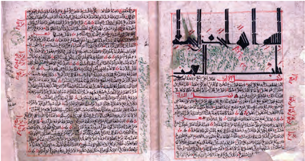
تصویر (۳): الصحاح با خط حسن بن حسین (کتابخانه ملک، ش ۳۵۵)