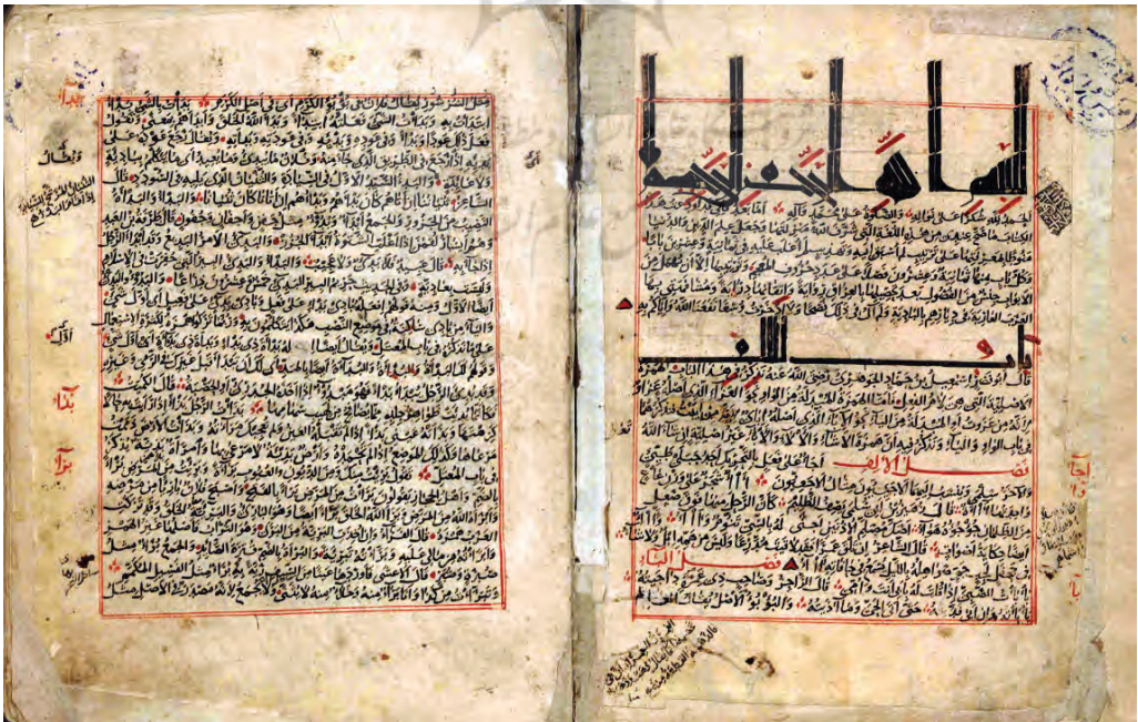
تصویر (۴): الصحاح (کتابخانه مجلس، ش ۸۳۴۷)