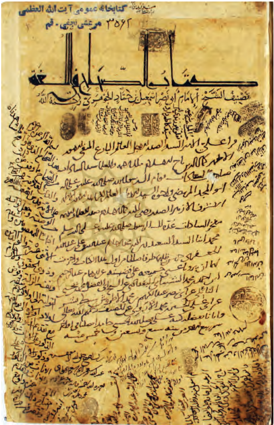
تصویر (۱): اجازة عزالدین علی بن فضل الله الراوندی بر کتاب الصحاح (مرعشی شماره ۳۵۶۲)