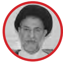
سیدعباس رهنوی *

حرکت مشروطه ایران به اندیشه تحول طلبی حوزه نجف مدد رساند. رهبران مشروطه عمدتاً از علمای ایرانی ساکن نجف بودند و شاگردان میرزای شیرازی و آخوند خراسانی از نظریه پردازان و جلوداران تحول آموزشی و تبلیغی آن به شمار می رفتند. در دوره آخوند خراسانی روحی تازه در کالبد حوزه نجف به جریان افتاد و تکاپو درباره بازگشت به تمدن اسلامی، اصلاح حوزه، نقش آفرینی و هم اندیشی های حوزویان درباره مسائل کشور، عدالت طلبی، آگاهی از جهان پیرامون و ارتباط با جهان اسلام و نیز مبارزه با فقر، جهالت، رواج صنایع، بهداشت، مجلات و چاپخانه افزون گرفت.