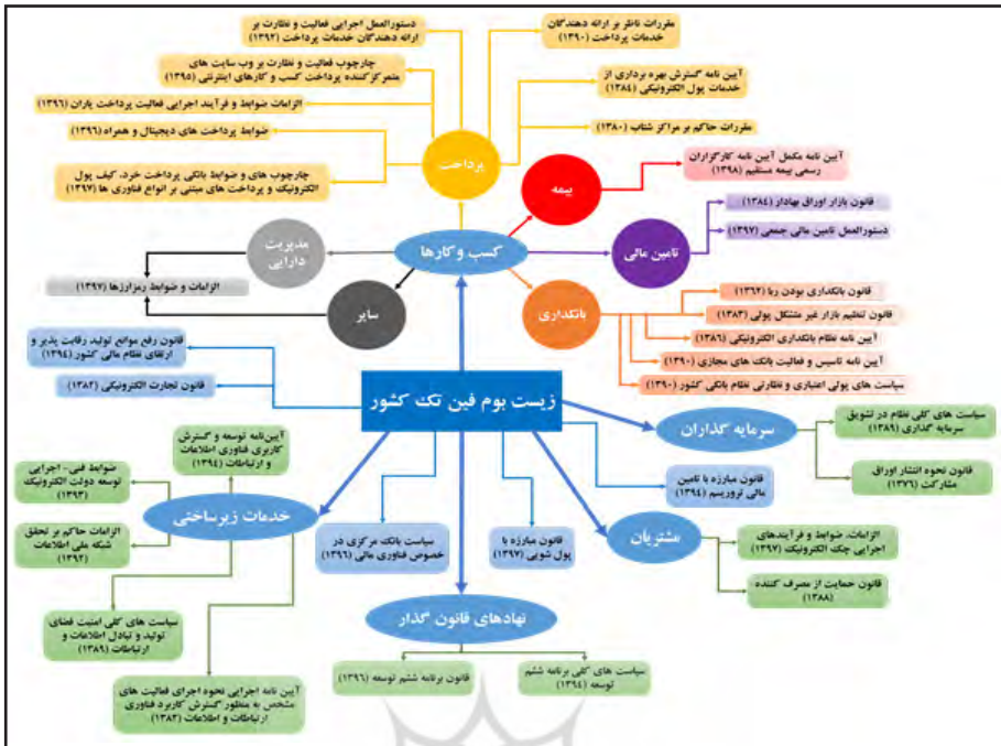
نمودار (۳): ارتباط اسناد فرادستی با اجزای زیست بوم و حوزه های کسب و کار فین تک