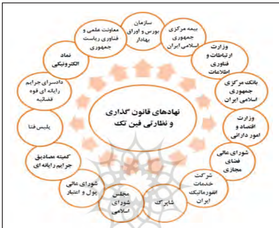
نمودار (۲): نهادهای مؤثر بر سیاست‌گذاری، قانون‌گذاری و نظارت بر فین تک‌ها

علاوه بر قوانین مذکور، پایگاه‌های اطلاعاتی برخی از نهادهای مهم و مؤثر در عرصه رگولاتوری در اقتصاد و کسب‌وکار نیز شناسایی و اسناد مرتبط با پژوهش حاضر مطالعه گردیدند (نمودار (۲)).