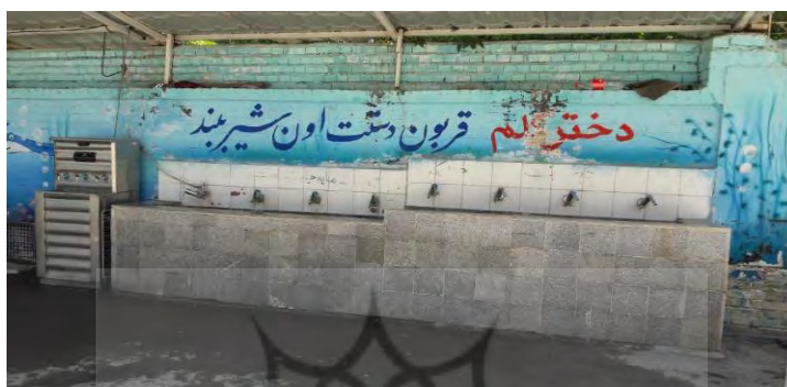
شکل ۲. نمایی از آبخوری و دیوار نوشته آن

آبخوری بود که به بچه‌ها سفارش کرده بود شیر آب را ببندند؛ در حالی که بسیار بیشتر از این، ظرفیت توجه به مؤلفه‌های مختلف اقتصاد مقاومتی از جمله ایجاد فرهنگ در خصوص حمایت از تولید ملی و دوری از اسراف و تجمل وجود دارد.