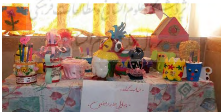
شکل ۳. تصویری از نمایشگاه وسایل دورریختنی

روش‌های تدریسی که معلمان در کلاس‌ها استفاده می‌کنند به طور عمده مبتنی بر روش‌های غیر فعال و سخنرانی است که در این حالت معلم نقش اصلی را در تدریس به عهده دارد و دانش‌آموزان نیز پذیرنده و منفعل می‌باشند. به جز دو معلم که اعتقاد به کارگروهی و گفت و گو در کلاس داشتند و گاهی اوقات وظیفه تدریس را به بچه‌ها محول می‌کردند؛ سایر معلمان خودشان عهده‌دار تدریس در کلاس بودند. در فعالیت‌هایی که در کلاس‌ها انجام می‌شد؛ کارهای عملی مانند درست کردن کاردستی یا انجام آزمایش‌ها به ندرت صورت می‌گرفت؛ معلمان به انجام فعالیت‌ها در قالب گروهی اعتقاد زیادی نداشتند و در کلاس از کارهای گروهی کمتر استفاده می‌کردند. چنین نیمکت‌ها نیز در همه کلاس‌ها عموماً به صورت سنتی و ردیفی بود که خود مانعی برای فعالیت‌های گروهی دانش‌آموزان در کلاس است. جمعیت کلاس‌ها زیاد است در کلاس به طور میانگین در حدود ۳۰ الی ۳۲ دانش‌آموز حضور دارد. بنابراین، روش‌های تدریس و فعالیت‌های کلاسی از این منظر ناهمسو با مؤلفه‌های «اقتصاد دانش بنیان»، «صیانت از وحدت و همبستگی» و «استفاده حداکثری از زمان، منابع و امکانات» می‌باشد. محدود نمایشگاه‌هایی همچون ساخت کاردستی با وسایل دورریز و طرح جابربن حیان که می‌تواند خلاقیت، ابتکار و روحیه جست‌وجوگری را در دانش‌آموزان ایجاد کند؛ در مدرسه برگزار شده است که می‌توان گفت در راستای مؤلفه یادشده یعنی «اقتصاد دانش بنیان» بوده؛ اما کیفیت و کمیت این نمایشگاه‌ها مناسب نبوده است.