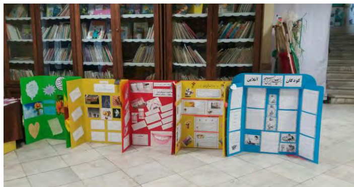
شکل ۴. تصویری از نمایشگاه طرح جابرین‌حیان

در زنگ‌های ورزش و هنر آن‌طور که باید فعالیت تخصصی انجام نشد و هم‌ردیف دروسی مانند ریاضی به آنان بها داده نمی‌شد؛ اقدامی که موجب می‌شود بسیاری از استعداد‌های دانش‌آموزان در این زمینه کشف نشده باقی بماند. این اقدام علیه مؤلفه‌های «استفاده حداکثری از زمان، منابع و امکانات» و «استفاده از همه ظرفیت‌های مردمی» است. مواردی از عدم رعایت قوانین از سمت معلمان در حضور دانش‌آموزان دیده شد (مانند آمدن به سرکلاس خارج از زمان مقرر)؛ همچنین، قوانین غیر منطقی و نامنعطفی از سمت آنان برای کلاس‌ها در نظر گرفته شده بود که همگی این موارد در تناقض با مؤلفه «حرکت بر اساس برنامه و پرهیز از تصمیم‌های آنی و تغییر مقررات» است.