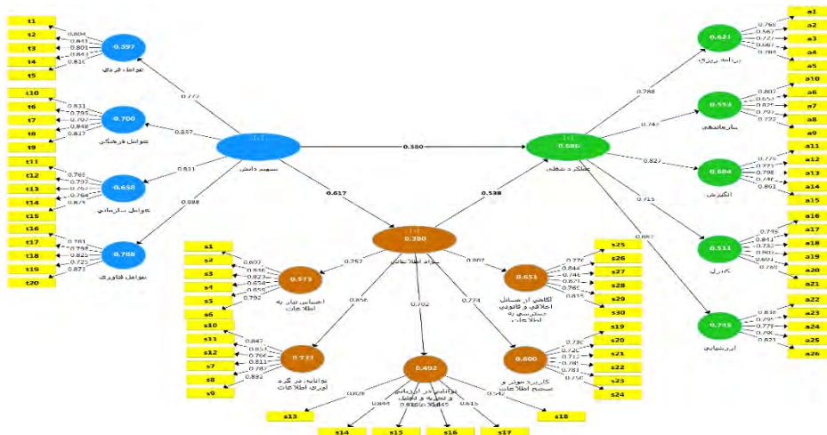
شکل ۱. مدل نهایی با ضرایب استاندارد شده بار عاملی و ضرایب مسیر