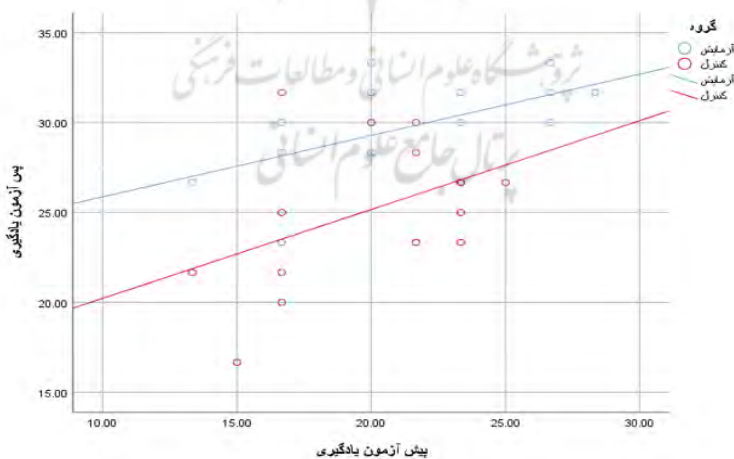
شکل ۲. پراکنش داده‌های پیش و پس‌آزمون یادگیری به تفکیک گروه

فرضیه اول: فناوری واقعیت افزوده بر یادگیری دانش‌آموزان پایه هفتم متوسطه در درس زبان انگلیسی تأثیر دارد. نتایج مربوط به این فرضیه پژوهش در شکل ۲ و جدول ۲ ارائه شده است.