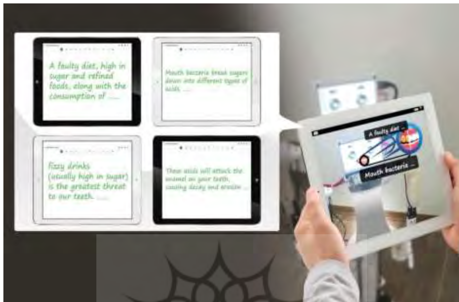
شکل (۲): نمونه‌ای از داستان‌پردازی طرفداران بر روی ربات اجتماعی

در هر جلسه، بعد از پایان تمرین نوشتاری و خوانداری از طریق داستان‌پردازی طرفداران به کمک ربات اجتماعی، شرکت‌کنندگان از طریق لینک اتصال نرم‌افزار آموزشی Adobe Connect در کلاس‌های آموزش برخط حضور می‌یافتند. هر شرکت‌کننده به شکل انفرادی ۴۵ دقیقه مهارت‌های نوشتاری یا خوانداری انگلیسی یا فارسی با اهداف پزشکی را فرا می‌گرفت. سپس، در همین جلسه فعالیت‌های سنجش در اختیار هر شرکت‌کننده قرار داده شد تا به پرسش‌های آن در مدت ۱۵ دقیقه پاسخ دهد و نمره‌ای از صفر تا ۲۰ برای هر مهارت برای وی ثبت می‌شد. هشت استاد رشته‌ی تخصصی به همراه چهار استاد آموزش زبان انگلیسی و فارسی، آموزش و ارزیابی تجمیعی ۱ شرکت‌کنندگان را بر عهده داشتند.