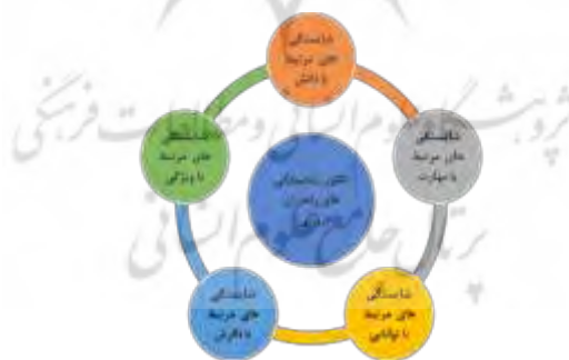
شکل ۲- الگوی شایستگی‌های حرفه‌ای راهبران آموزشی و تربیتی

از سوی دیگر، بررسی بارهای عاملی نشان می‌دهد که از بین زیر مؤلفه‌های ویژگی‌های فردی، گشودگی و پذیرش از اهمیت بالاتری برخوردار است و پس‌از آن به ترتیب؛ اخلاق حسنه، وجدان کاری، انعطاف‌پذیری، اقتدار و دغدغه‌مندی، در اولویت قرار دارند. نتایج به‌دست‌آمده در این بخش هم‌راستا با نتایج پژوهش‌های (Johari & Amat(2021)؛ Daryono et al(2020)؛ Susanto et al(2020)؛ Winburn et al(2019) می‌باشند. همان‌گونه که پیش‌تر اشاره شد در هزاره سوم، راهبران آموزشی باید از دانش لازم در حوزه‌های تخصصی مرتبط با حرفه خود و همچنین سازمانی که در آن کار می‌کنند برخوردار باشند. بررسی بارهای عاملی نشان می‌دهد که به ترتیب دانش تخصصی در حوزه‌هایی نظیر؛ مدیریت کلاس‌های چندپایه، فرایند یاددهی-یادگیری، نظارت و راهنمایی آموزشی و درنهایت آموزش ابتدایی دارای اهمیت می‌باشند. نتایج این بخش از پژوهش با تحقیقات Johari & Amat(2021) و Daryono et al(2020) نیز همسویی دارد. درنهایت، بررسی بارهای عاملی زیر مؤلفه‌های نگرش نشان می‌دهد که به ترتیب؛ خوش‌بینی نسبت به نظارت و راهنمایی آموزشی، باور به مهارت‌های معلمان و دانش آموزان و داشتن نگرش مثبت در زمینه توسعه خود و دیگران از اهمیت بیشتری برخوردار هستند. نتایج حاصل از این بخش نیز با پژوهش‌های (Kumighad؛ Enaigbe(2009)؛ Mangiameli(2021)؛ et al(2020)؛ همسو می‌باشد. درنهایت می‌توان با توجه به تحلیل داده‌های کمی الگوی شایستگی‌های حرفه‌ای راهبران آموزشی را به‌صورت شماتیک(شکل شماره ۲) طراحی نمود.