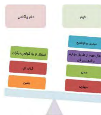
شکل ۲. مقایسه ویژگی‌های شناختی فهم و آگاهی

حقیقت علم در حکمت متعالیه، هم سنخ با وجود معرفتی می‌گردد و از آنجایی که ماهیت وجود قابل تعریف حقیقی نیست، معرفت نیز قابلیت تعریف حقیقی ندارد. وقتی صدرا بر اتحاد جوهر معرفت و وجود تصریح می‌کند، لاجرم اتحاد احکام و ویژگی‌های معرفت و وجود را نیز تأیید می‌نماید. «وجود» در حکمت متعالیه، امری مشکک معرفتی می‌گردد و از آنرو «معرفت» نیز همانند وجود امری مشکک و ذومراتب است. مشکک بودن معرفت و امکان دستیابی به معرفت‌های فراتر به معنای امکان شدت یافتن معرفت در حیطه‌های هر متعلق شناسایی است. انسان در هر مرتبه وجودی و اشتداد آگاهی پیدا می‌کند؛ اما این شدت یافتن در معرفت، با افزایش علم افراد و کسب معرفت‌های بیشتر و فزونی دانسته‌ها متفاوت است (Vafaeyan, 2017). بر مبنای نظریه‌ی اتحاد عاقل و معقول ملاصدرا آن‌چنان‌که «شیء متحرک در حرکت جوهری در واقع لبس بعد اللبس صور است،