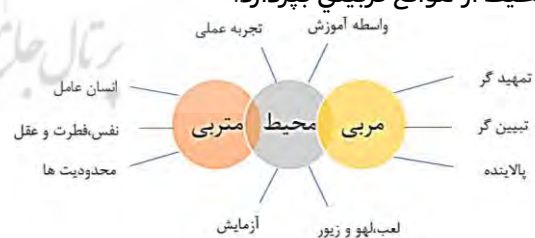
شکل ۱- رابطه محیط و عوامل تربیتی با ویژگی های شناختی - مأخذ (محقق)

آموز تأثیر بگذارد» (Hansen, 2000). بر این ادعا مریبی از راه محیط فیزیکی- دانش آموز را به عنوان انسان عامل در زندگی، دارای احساس و عمل- نوع آموزش را آگاهانه کنترل می کنند. این نکته قابل توجهی در اندیشه دیویی است که پالایش را در این محیط به صورت غیر مستقیم عنوان می کند تا هم عاملیت و اراده ی دانش آموز زیر سؤال نرود و هم در عین آزادی او، اکراهی برای همراهی مریبی بودن در محیط آموزشی از خود نشان ندهد. این نکته در ادامه تعریف سند تحول از پالایش نیز مطرح شده است؛ «از آنجا که پالایش به قصد حمایت از رشد و تعالی متریبان صورت می گیرد، نباید به شکل تحمیل و تهدید یا محدودسازی افراطی ظاهر شود» (Supreme Council of the Cultural Revolution, 2012). تعاریف و روابط بین محیط و عوامل تربیتی با ویژگی های شناختی آن در شکل (۱) محیط را با ویژگی واسطه ی آموزشی برای کسب تجربه ی عملی معرفی می کند و مریبی با توانمندی هایی که دارد زیر نظر مریبی که نقش تمهیدگر و تبیین گر محیط را دارد باید به زدودن محیط از موانع تربیتی بپردازد.