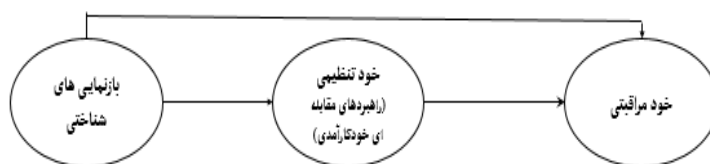
شکل ۱: مدل مفهومی خودمدیریتی بیماری دیابت در نوجوانان: نقش مؤلفه‌های خودتنظیمی و بازنمایی‌های شناختی