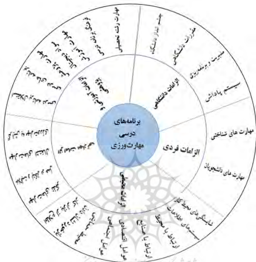
شکل ۳: الگوی برنامه درسی مهارت و ورزی در آموزش عالی بر اساس مطالعات انجام شده داخلی و خارجی