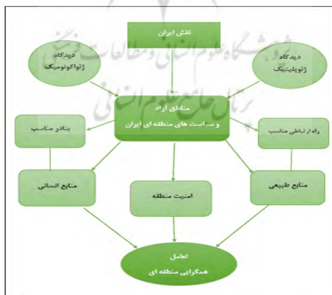
نمودار ۱. مدل مفهومی؛ مناطق آزاد و سیاست‌های منطقه‌ای

برای ترسیم نقشی نوین در آینده برای مناطق آزاد لازم است دو رویکرد مهم اقتصاد دانش محور و جهانی شدن مد نظر قرار گیرد. خوشبختانه در اهداف برنامه چهارم این رویکردها لحاظ شده و نقشی قابل توجه به مناطق آزاد اعطا شده است. در نظامات امروزی جهان حضور علم در همه تصمیمات، قواعد و قوانین و در تمام شئون اجتماعی، اقتصادی، سیاسی و فرهنگی و حتی نظامی قابل مشاهده است و بر این اساس قرن بیست و یکم را قرن دانش محور اطلاق می‌کنند. بر مبنای اقتصاد دانش محور، توسعه ملی در هر کشور به میزان ارزش اقتصادی تولیدات آن کشور بستگی دارد که در زنجیره ارزش اقتصاد جهانی ایجاد می‌شود. بر این اساس لازم است مناطق آزاد به مناطقی تبدیل شوند که در امکان ایجاد تعامل میان دانش و تولید و تجارت تسهیلات بیشتری فراهم نمایند. از سوی دیگر با جهانی شدن اقتصاد شاهد آن هستیم که تولید و تجارت جهانی گسترش یافته و کشورها با عضویت در سازمان جهانی تجارت و گسترش به حذف موانع تجاری و گسترش تجارت نائل موافقتنامه‌های تجاری منطقه‌ای (RTAs) آمده‌اند.