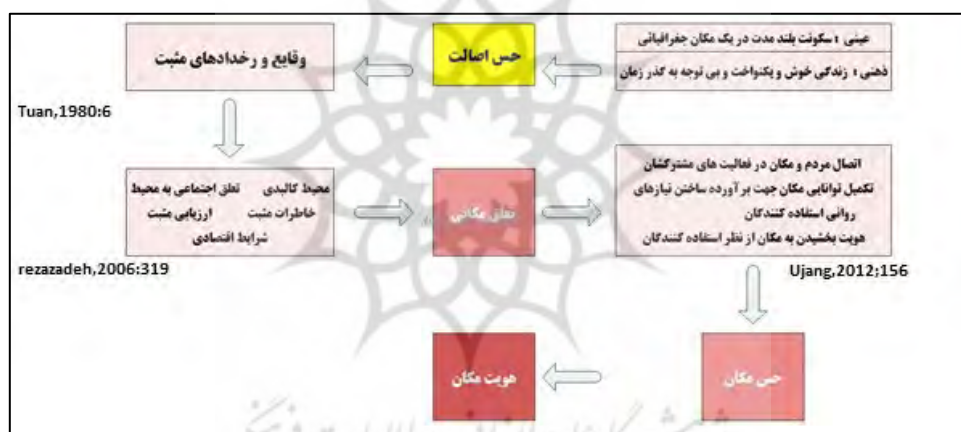
نمودار شماره ۱- جایگاه اصالت در افزایش هویت مکان و تعلق مکان

داری انسان به یک مکان خاص و افراد می‌گردد» (Salvesen,2002;68). در نظر سالواسن، مراقبت از جنبه‌های عاطفی، فرهنگی و معنوی مکان در ایجاد اصالت و ریشه داری انسان به مکان تاثیرگذار است. حس اصالت (ریشه داری)، از ملزومات خاطرات مثبت می‌باشد. وقایع در رخدادهای مثبت موجب ایجاد خاطرات مثبت می‌گردد و همین امر خاطرات مثبتی را در افکار فرد از مکان ایجاد می‌کند. این امر تعلق مکانی را افزایش می‌دهد و موجبات ایجاد هویت مکانی می‌گردد» (Rezazadeh,2006;319). حس تعلق مکان موجب اتصال مردم و مکان در فعالیت‌های مشترکشان می‌گردد. حس تعلق مکان توانایی مکان را جهت برآورده ساختن نیازهای روانی استفاده کنندگان و برآورده کردن احساساتشان تکمیل می‌کند» (Ujang, 2012:156). از نظر او جان، حس تعلق مکان موجب الهام بخشیدن به مکان در نظر استفاده کنندگان و هویت بخشیدن به مکان از نظر استفاده کنندگان می‌گردد. عوامل و فرآیندهای مختلفی باعث ایجاد تعلق مکانی می‌شوند. به نظر توان، ریشه داری در مکان به معنای همبستگی و یکی شدن فرد با مکان است. بر این اساس تصویر شماره (۱) فرایند تاثیر اصالت در افزایش هویت مکان و تعلق مکان بیان می‌کند.