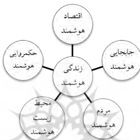
شکل ۱: زندگی هوشمند بعنوان هدف اصلی، منبع: (Oetelaar,2017:33)

نوآوری برای یادگیری و کار (شهروند و اقتصاد هوشمند) و نهایتاً هماهنگی بین همه این تلاش‌ها از طریق ابزارهای مدیریتی متمرکز (حکروایی هوشمند)، هماهنگی و ارتباط ایجاد کرد (Appio,2018:6). جهت توضیح بیشتر می‌توان گفت عامل سلامت به طور مستقیم با محیط زیست مرتبط است، که تا حدودی مربوط به راه‌های جابجایی و حمل و نقل در کاهش آلودگی است. امکانات آموزشی مربوط به تمایل مردم برای یادگیری و همچنین نقش دولت در ارائه و تسهیل آنها است. یک اقتصاد هوشمند و نوآورانه، از طریق ارائه راه حل مشکلات شهر و همکاری در حل آنها، به شرایط زندگی کمک می‌کند. و در نهایت، شهروندان هوشمند با دسترسی به دولت خود می‌توانند بر شرایط زندگی خود تاثیرگذار باشند و بر سیاست‌های شهر تاثیر بگذارد (Oetelaar,2017:34) (شکل شماره ۱).