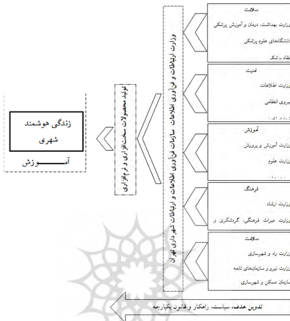
شکل ۳: فرآیند هوشمندسازی زندگی شهری در کلانشهر تهران، منبع: یافته‌های پژوهش، ۱۳۹۸

در این مقاله ابعاد و شاخص‌های زندگی هوشمند ارائه گردید. مسلماً در میان مطالعات و پژوهش‌های صورت گرفته در ابعاد دیگر شهر هوشمند شاخص‌های متعددی شناسایی و ارائه شده‌اند که این موضوع می‌تواند مسیرهای مطالعاتی بسیاری برای محققین و علاقه‌مندان محسوب گردد تا با بررسی پژوهش‌های مذکور گامی موثر در شناسایی و تبیین تمامی شاخص‌ها صورت گیرد.